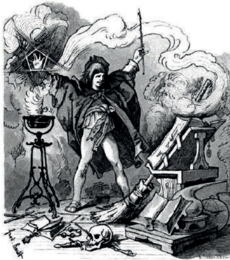
Abbildung 2: Ferdinand Barth, Der Zauberlehrling , 1882.

Tagtäglich entscheiden sich Leute für kosmetische Eingriffe, um jünger auszusehen, einschließlich Facelifting und tummy tucks [Bauchstraffung] (so der niedliche Ausdruck für eine ziemlich hässliche Prozedur) oder liposuction , was ein freundlicheres Wort für das ist, was in Deutschland schlicht ‚Fettabsaugung‘ heißt. Damit gehen die oben erwähnten rhinoplastischen Korrekturen, einschließlich von Nasen-Implantaten (gegen den Michael Jackson-Effekt) oder Brust-Implantaten einher, um auch ohne Fitnessstudio zu einer muskulösen Brust zu kommen oder einen sogenannten Six-Pack-Bauch vortäuschen zu können, ohne sich tagtäglich von Neuem daran abarbeiten zu müssen.