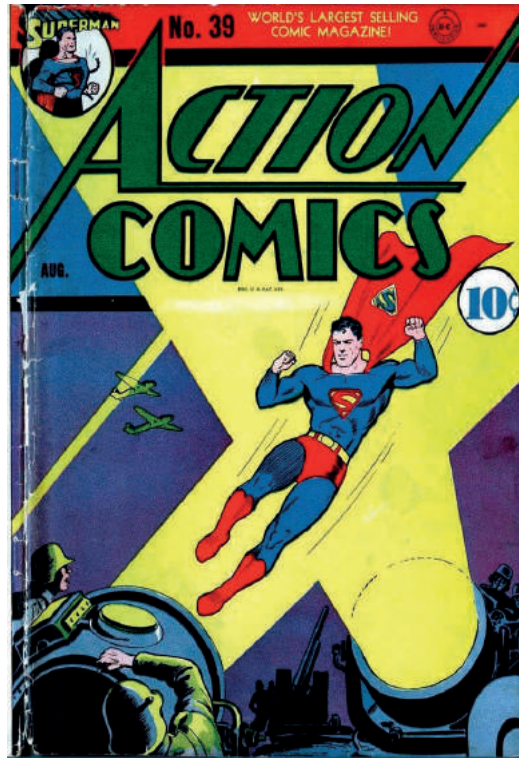
Abbildung 3: Action Comics Nr. 39, „The Man With the Radioactive Touch,” August 1941.

Wenn manche Leute schreiben, es gebe eine Verbindung zwischen Nietzsche und dem Ideal des Transhumanismus, dann ist die Comicfigur Superman eher als der Nietzschesche Übermensch das beste Beispiel, um darüber nachzudenken. Es ist aber schon auffällig, wie leicht fließend man sich vom Übermenschen in seiner ganzen Vielschichtigkeit zur Comicfigur des Superman hinbewegt. Und in der Tat ist dieser Übergang ein medialer: vom Text über die Bühne zum Film. Nietzsches erschriebener Zarathustra, der die Lehre des Übermenschen verkündet, wurde wohl von George Bernhard Shaw in seinem 1903 geschriebenen Stück in vier Akten Man and Superman in die englische Welt des Dramas überführt. 7 Natürlich ist die Verknüpfung mit Nietzsche durchaus eine Karikatur. Doch als solche ist sie natürlich auch eine gefährliche, nicht zuletzt weil sie verschiedenste Verkörperungen des Transhumanismus durch die Nazi-Eugenik wachruft, von Leni Riefenstrahls NS-Propagandafilm Triumph des Willens