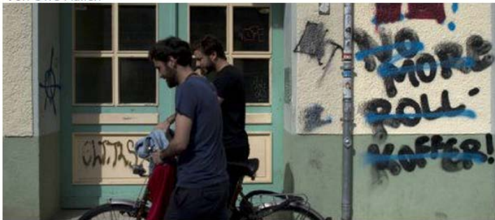
An Hauswänden sprühen die geplagten Bewohner ihren Ärger.

Abbildung 2: Berliner Zeitung vom 7.8.2015 ( http://bit.ly/1gPD2IV ; abgerufen am 15.12.2015)