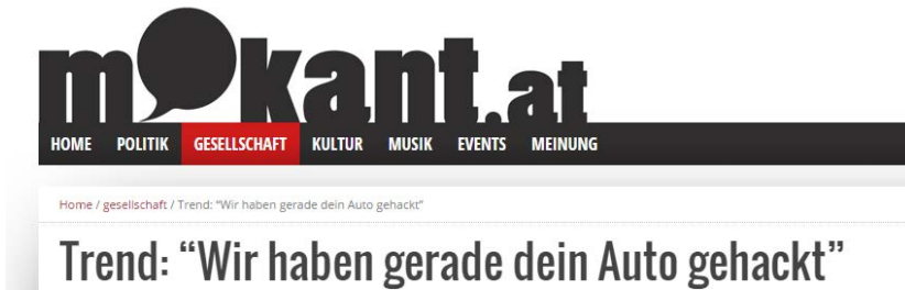
Abbildung 4: Mokant vom 16. Juni 2015 ( http://mokant.at/1506-self-driving-car-google-selbst-fahrende-autos-ai-1 ; abgerufen am 15.12.2015)

Das selbstfahrende Auto, das in den nächsten 20 Jahren wahrscheinlich immer realer wird, legt die Verantwortlichkeiten im Autoverkehr völlig neu fest: Wer ist schuld, wenn es zu Unfällen kommt? Kann man die Elektronik dieser Autos auch hacken? Soll man sich total in die Hände der Technologie geben und auf das eigene Steuern seines Fahrzeugs verzichten? Wie funktioniert diese Technik überhaupt?