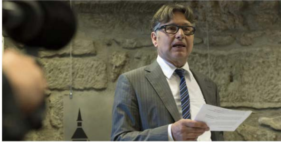
Der oberste Schweizer Datenschützer, Hanspeter Thür, warnt vor der zunehmenden Beliebtheit von Internet-Pranger.

von D. Pomper - Der oberste Schweizer Datenschützer Hanspeter Thür warnt im Interview vor Überwachungsdrohnen und Kameras in Toiletten. Er plädiert für eine Stärkung der Datenschutzaufsicht.