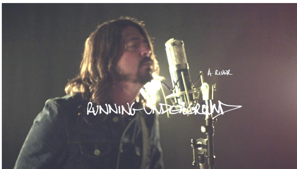
Abb. 1: Performance I Am A River. „New York“, Sonic Highways. (Still aus Episode 1.08, Foo Fighters. Sonic Highways. Every city has a sound. Every sound has a story,)

Do you know the story about the record at the Magic Shop that David Bowie made? The one that he made in secret? – The most [...] New York thing about the David Bowie record, The Next Day , is that he made it in New York and nobody knew a goddamn thing about it. [...] The thing that's really interesting about New York is it's one of the most public cities in the world, and it's one of the most private. You can do some of your best work, and do it totally under the radar. 6