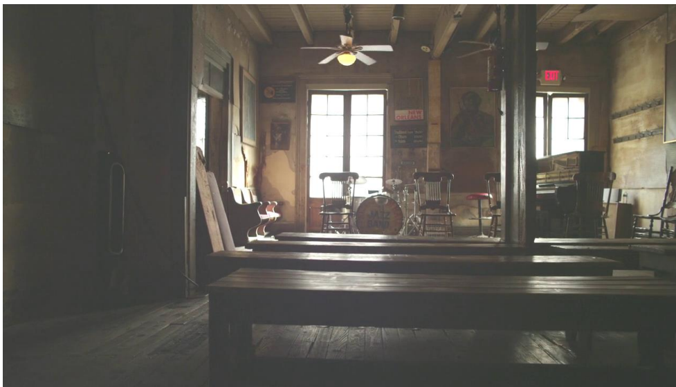
Abb. 3: Innenraum der Preservation Hall. „New Orleans“, Sonic Highways . (Still aus Episode 1.06, Foo Fighters. Sonic Highways. Every city has a sound. Every sound has a story , © HBO/Sony Music Entertainment Germany 2014/2015)

When I think of New Orleans, I don't think of recording studios really. I just think of hundreds of years of music. Preservation Hall really took hold after the hurricane, when people realized that there was something to lose. 22