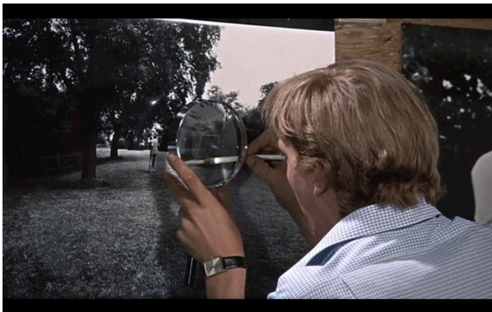
Abb. 1: Blow-Up . TC 1:00:35.