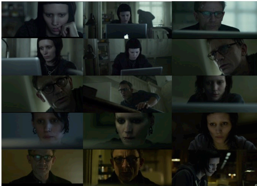
Abb. 5: Collage aus Screenshots aus The Girl with the Dragon Tattoo .