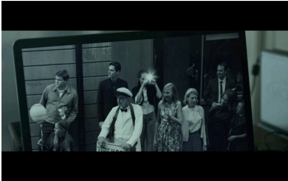
Abb. 2: The Girl with the Dragon Tattoo , TC 01:29:10.