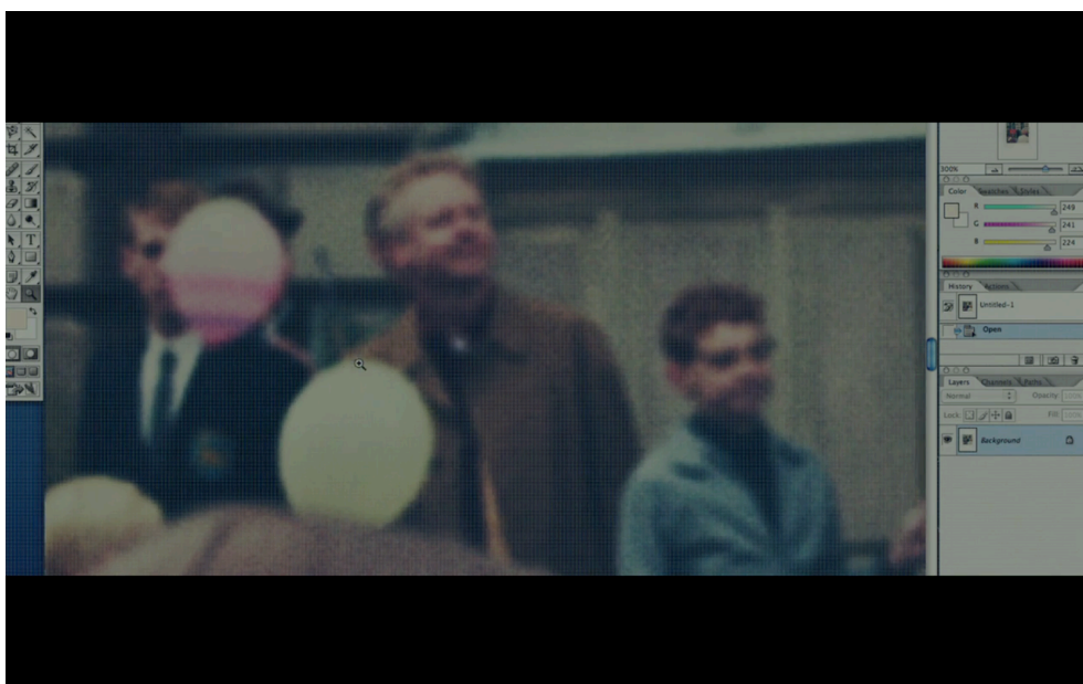
Abb. 3: The Girl with the Dragon Tattoo , TC 01:33:21.