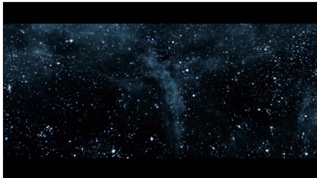
Abb. 1: Melancholia © (TC 00:50:30)

Wahrnehmungserfahrung, also dem Seherlebnis der diegetischen Figur zuzuordnen. 18