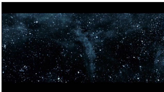
Abb. 1: Melancholia © (TC 00:50:30)

Wahrnehmungserfahrung, also dem Seherlebnis der diegetischen Figur zuzuordnen. 18