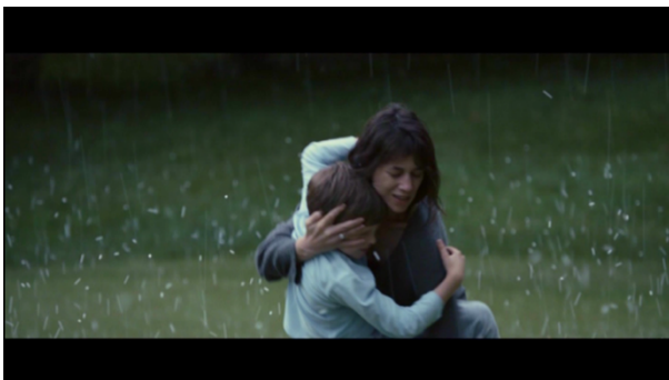
Abb. 4: Melancholia © (TC 01:54:21)

Geschehen und erhält dabei einen durchweg integrierten Status innerhalb der geschilderten Naturerfahrung.