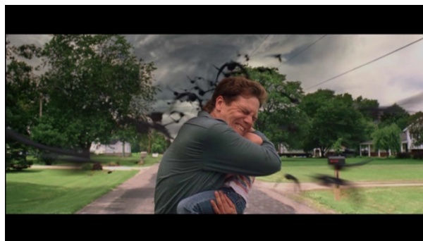
Abb. 5: Take Shelter © (TC 01:33:51)

Der Wunsch nach Schutz vor einer übermächtigen und lebensbedrohlichen Natur manifestiert sich auch im außerkörperlichen Raum. In Take Shelter wie in Melancholia suchen die Protagonisten Obdach in einem selbst gebauten Zufluchtsort. Dass es sich bei diesem in Melancholia im Wesentlichen um ein psychologisches Refugium in Form einer skelettartigen Konstruktion aus Holzstangen und damit in keiner Weise um ein tatsächliches Versteck vor der bevorstehenden Kollision handelt, ist an dieser Stelle zweitrangig. Vor allem das vertrauensvolle Verhalten des Kindes, welches sich intellektuell betrachtet mit Sicherheit über die nahende Katastrophe im Klaren ist, macht deutlich, dass Justines „magische Höhle“ hauptsächlich einen seelischen Unterschlupf darstellt. Auch in Take Shelter offenbart Curtis' manische Besessenheit von dem Bau des Sturmbunkers ein primär psychisches Bedürfnis, welches wiederum unweigerlich an das Verlangen nach körperlichem Schutz gekoppelt ist vor etwas, das ihm rational nicht erklärbar, aber dennoch auf akut leibliche Weise bewusst ist.