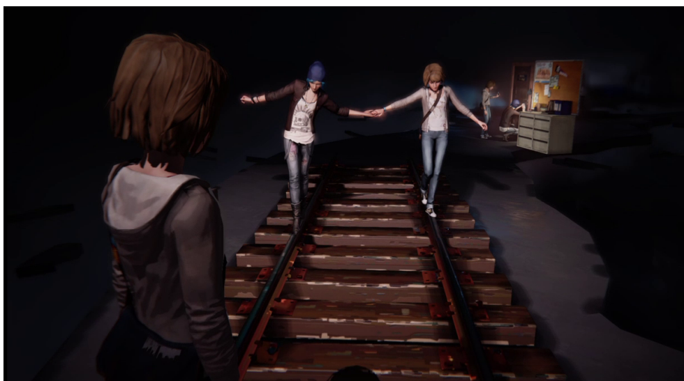
Abb. 4–5: Die Originalszene (oben) und die Reinszenierung (unten)

Die Traumsequenz stellt eine Defragmentierung der seriellen Geschichte des Spiels dar, denn die Teilräume werden in einen linearen Gesamtzusammenhang montiert. Gerade in Spielen mit einem hohen Grad an Agency , wie es in Life is Strange der Fall ist, ist ein einheitliches Spielerlebnis nicht zwingend gegeben. Die Kontingenz, die durch den Spieler ins Computerspiel gebracht wird, weiß dies zu verhindern. Eine durchschaubare Raumstruktur sowie die Simulation Gap arbeiten dem entgegen. Aus diesem Grund ist der Erinnerungsweg linear gestaltet und den Szenen ihre Bewegung genommen. Die starre, fotografische Bildlichkeit wirkt in Life is Strange komplexitätsreduzierend, weil sie die Interaktion verhindert. Und ebenso bringt sie dem Spieler Einheitlichkeit, wenn sich die fragmentarischen Raumzellen als 3D-Fotografien zu einer Ganzheit ergänzen.