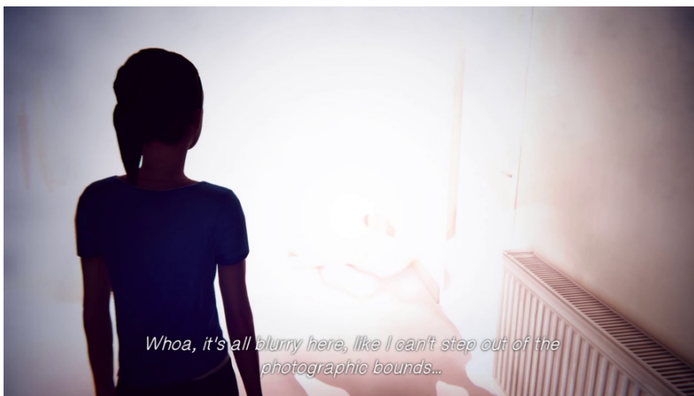
Abb. 2: Die ‚fotografische‘ Grenze hindert Max daran, die Raumzelle zu verlassen

Bemerkenswert ist zudem, dass die Raumgrenze als unscharf („blurry“) bezeichnet wird, was gerade nicht im Sinne von Dubois einen sauberen Schnitt nahelegen würde. Schaut man sich die Grenze genauer an (Abb. 3), dann fällt auf, dass es sich bei der Unschärfe um das Ende des fotografischen Films handeln muss. Die Spielfigur kann aber nicht aus dem fotografischen Film in die Unschärfe schreiten, sondern wird zuvor durch eine Wand gestoppt, womit ein exakter Raumschnitt vorliegt. Der Zeitschnitt wird wiederum über eine Zeitschleife vollzogen, durch die sich die Szene solange wiederholt, bis der Spieler die richtige Aktion ausführt.