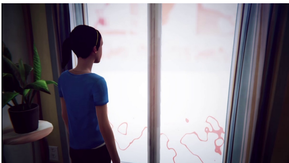
Abb. 3: Mit dem ‚fotografischen‘ Film endet auch die Raumzelle

Bemerkenswert ist zudem, dass die Raumgrenze als unscharf („blurry“) bezeichnet wird, was gerade nicht im Sinne von Dubois einen sauberen Schnitt nahelegen würde. Schaut man sich die Grenze genauer an (Abb. 3), dann fällt auf, dass es sich bei der Unschärfe um das Ende des fotografischen Films handeln muss. Die Spielfigur kann aber nicht aus dem fotografischen Film in die Unschärfe schreiten, sondern wird zuvor durch eine Wand gestoppt, womit ein exakter Raumschnitt vorliegt. Der Zeitschnitt wird wiederum über eine Zeitschleife vollzogen, durch die sich die Szene solange wiederholt, bis der Spieler die richtige Aktion ausführt.