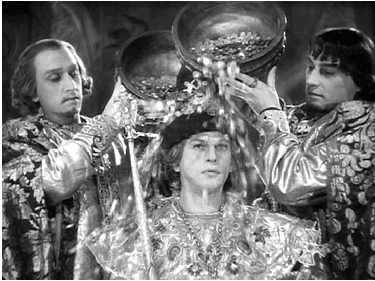
3 Nikolai Cherkasov als Zar Iwan IV.

Blick affiziert, sich aber nicht semantisch erschließt. Als Beispiel nennt Barthes die «Schminke der Höflinge, die hier dick und auffallend, dort glatt und sorgsam aufgetragen ist», oder die «dumme» Nase des einen, die fein nachgezeichneten Augenbrauen des anderen, sein fades blondes Haar» (1990a [1970], 48; Abb.3). Während der zweite, symbolische Sinn offenbar von Eisenstein intendiert war und insofern «entgegenkommend» sei, gibt sich der dritte Sinn als «stumpf», weil er wie ein «Überschuss» wirkt und die Lektüre an ihm ableitet (ibid, 50).