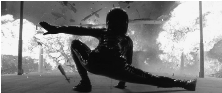
2 MATRIX REVOLUTIONS (Andy & Lana Wachowski, USA 2003)

seinem Ende, wenngleich in einer abschließenden Volte das Ziel der Begierde, der Geldsack, auch den beiden Protagonisten entgleitet. In MATRIX REVOLUTIONS liegt die narrative Funktion einerseits in der Irreführung des Zuschauers, dem der diegetische Status der Sequenz erst zum Schluss offenbart wird. Andererseits dient die Sequenz auch der Charakterisierung der Figur Neo; sie verdeutlicht seine emotionale Verbindung zu Trinity.