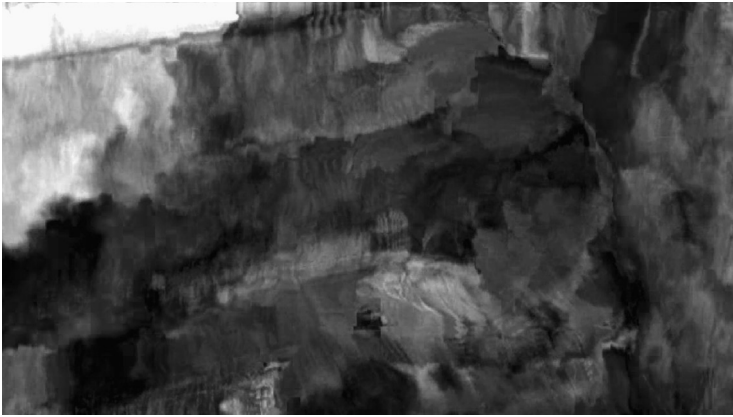
5 Data-moshing in Nicolas Provosts LONG LIVE THE NEW FLESH (Video-projektion mit Ton, 2009)

Die derart entstehende Glitch-Art führt daher eine ganz eigene künstlerische Form der bildtheoretischen Bewegungsanalyse aus.