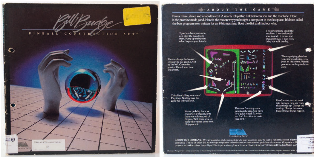
Abb. 2: Remix modularer Gestaltungselemente mit dem Pinball Construction Set.

Die Level-Gestaltung mit Lode Runner und Bill Budges Flipperbaukasten folgte bereits Anfang der 1980er Jahre dem Prinzip eines einfachen Remixes modularer Gestaltungselemente. Die Paratexte betonten die Einfachheit und Zugänglichkeit der Editorenspiele. Auf der Verpackung des Pinball Construction Sets hieß es: »No programming or typing is necessary. Just take parts from the set and put them on the game board. Press a button to play!« und auf der Rückseite des Kartons zu Lode Runner war zu lesen: