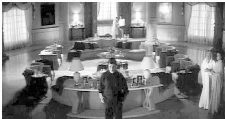
Yashvardhan Raichand (Amitabh Bachchan, v.) verstößt seinen Adoptivsohn Rahul (Shah Rukh Khan, h.) nach dessen eigenmächtiger Hochzeit.

verstößt er seinen Adoptivsohn. Rahul verabschiedet sich von seiner Mutter, die durch leichtes Nicken sein Handeln billigt, ohne jedoch die Stimme gegen ihren Mann zu erheben. Rahul berührt den Boden zu Füßen seines Vaters, faltet vor ihm in Verehrung die Hände, ohne dass dieser ihn ansieht und geht. Rahuls Mutter nimmt zwei ihrer Armreifen und gibt sie Anjali. Im Gehen ruft die junge Braut, dass sie nicht den Segen seines Vaters haben, worauf Rahul nur wortlos den Kopf schüttelt.