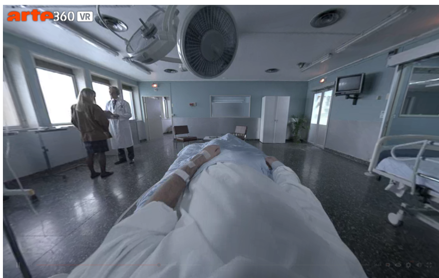
Abb. 1: Blick in den Raum und auf den virtuellen Körper. Screenshot aus I, Philip

sition eines Krankenhausbettes sehen. An dieser Stelle ist es möglich, den virtuellen Körper zu sehen, wenn die Rezipierenden ihren Kopf nach unten neigen (Abb. 1).