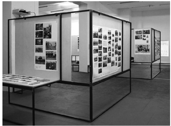
Abb. 6 Archive Journal Issue No 2: Discreet Violence: French Camps in Colonized Algeria, hg. v. Samia Henni, Berlin 2017