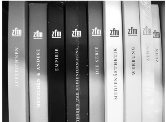
Abb. 1 Korrekturfahren der 2. Ausgabe der Zeitschrift für Medienwissenschaft , 2010