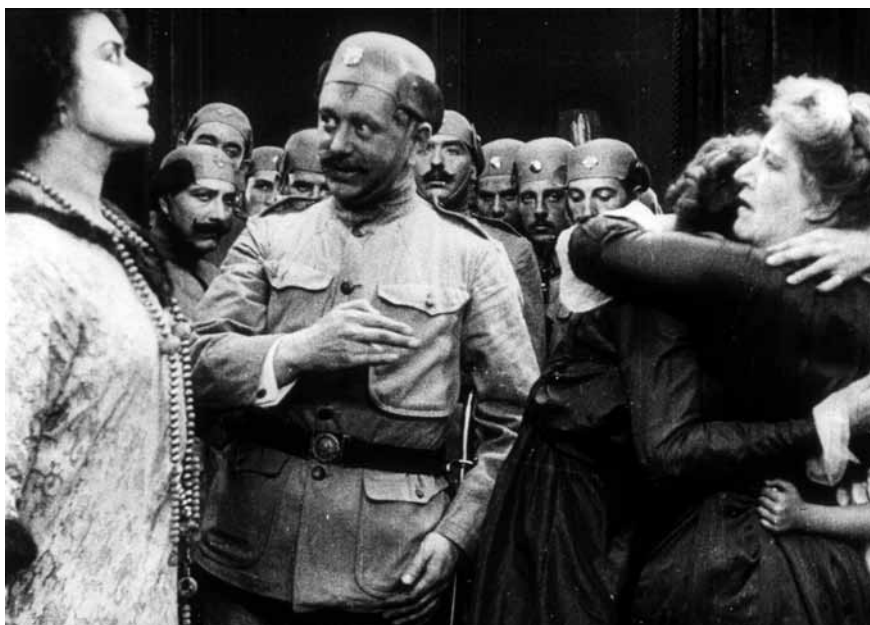
33 THE BATTLE CRY OF PEACE (US 1915)

tens zählt er mit dem Produktionsjahr 1915 zu den frühesten krass deutschfeindlichen Streifen und viertens gelangte er als einer von ganz wenigen Hunnenfilmen in der Schweiz während des Kriegs auch zur Aufführung. 1509