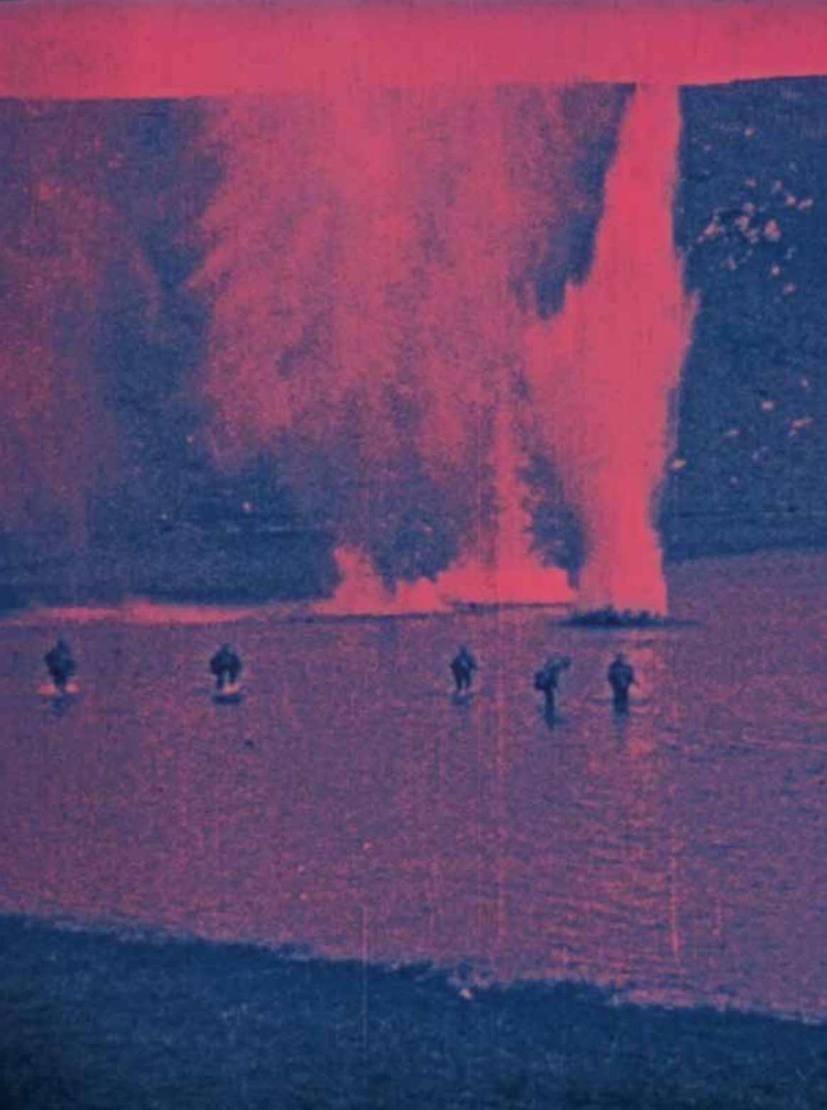
Einzelbild aus einer historischen Schweizer Vorführkopie des Propagandafilms DIE 10. ISONZOSCHLACHT (Ö-U 1917)