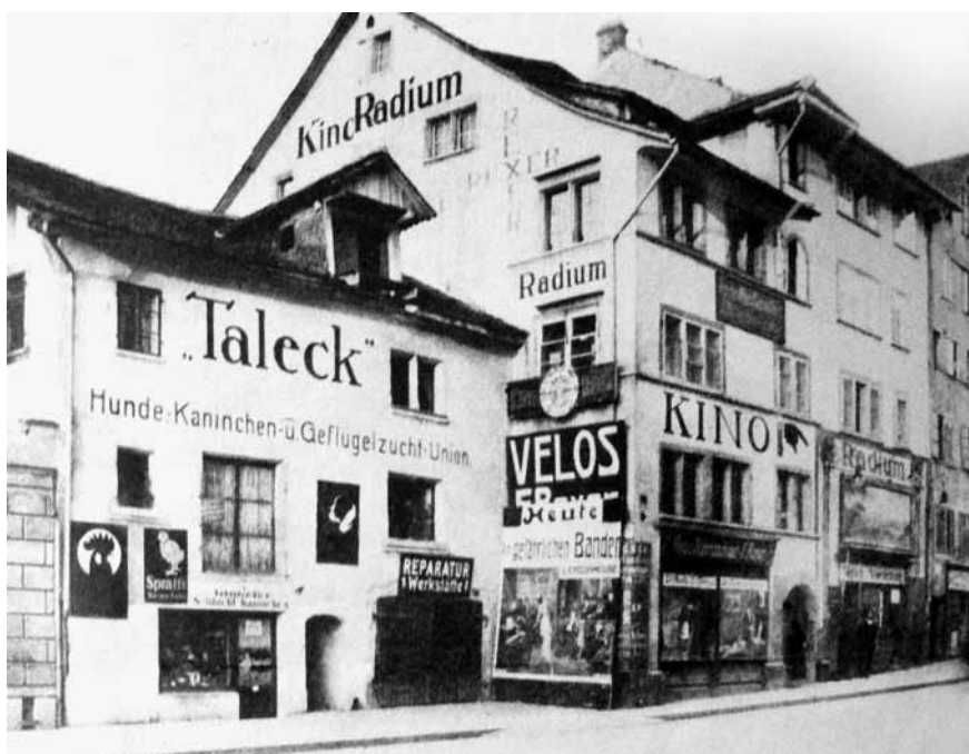
7 Kino Radium in Zürich um 1915

send mit minimalem Aufwand ihrer neuen Nutzung als Kino zuführte, gewann der Vorführraum durch die teilweise Zusammenlegung von Erdgeschoss und erstem Obergeschoss immerhin an Höhe. Sonst handelte es sich beim Radium um ein enges, architektonisch anspruchsloses und für die sogenannten Ladenkinos der Gründerjahre damit sehr typisches Etablissement (siehe Abb. 3a–b). Der Innenraum war schmucklos und mit Holzstühlen möbliert, die kleine Leinwand bedeckte die Stirnwand, deren Tür als Haupteingang des Kinos diente und direkt auf die Mühlegasse führte. Für die musikalische Begleitung des Filmprogramms war ein Klavier vorhanden. Nimmt man die Anekdote zum Nennwert, wonach in den ersten Zürcher Kinos der Pianist manchmal auch gleich für das Einkassieren des Eintrittsgeldes zuständig war, dürfte das Zielpublikum des Kinos Radium nicht aus Liebhabern gehobener Kunst und Musik bestanden haben. 310 Auch dem äusseren Erscheinungsbild des Kinos ging jegliche Ele-