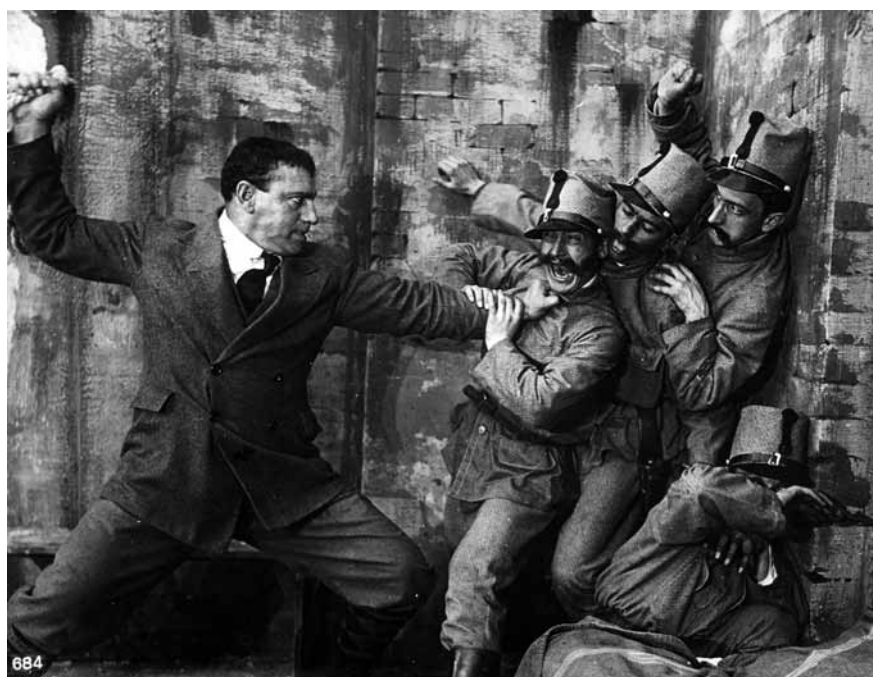
28 Standfoto zu MACISTE ALPINO (IT 1916)

finde ich es, um mich gelinde auszudrücken, absolut nicht angezeigt, Filme und Reklamematerial der Öffentlichkeit zu zeigen, die irgend eine Armee, sei es diese oder jene, als Zielscheibe brutalster Witze haben. 1307