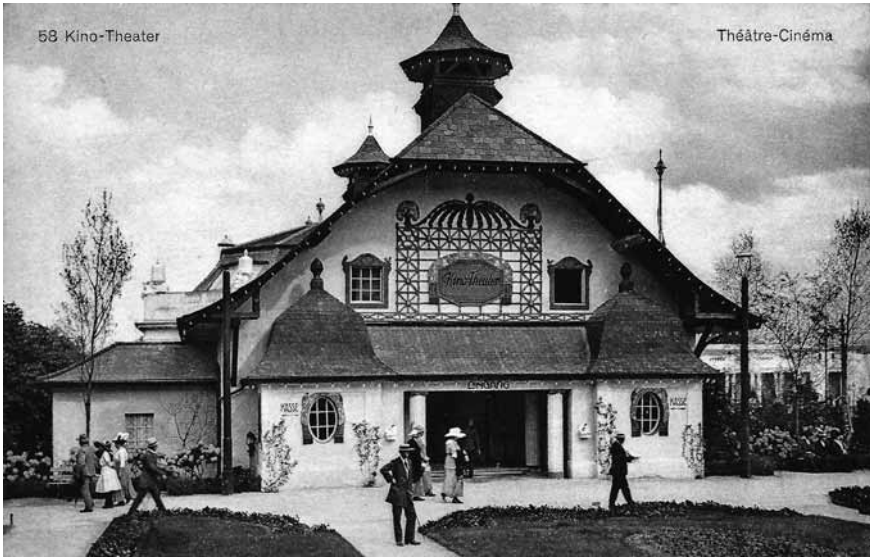
8 Ansichtskarte vom Kino an der Schweizerischen Landesausstellung 1914

duktions- und Verwertungsmöglichkeiten von Auftragsfilmen in einem kinoreformerischen Aufführungszusammenhang. 460