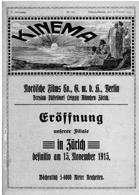
16 Anzeige der Nordischen Films Co.