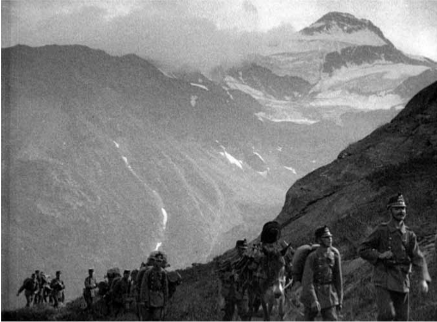
23 DIE SCHWEIZERISCHE ARMEE (CH 1918)

in zahlreichen Ortschaften aufgeführt wurde, stiess DIE SCHWEIZERISCHE ARMEE in der Deutschschweiz wie in der Romandie auf ein euphorisches Publikum. Auch die Filmkritik war mehrheitlich begeistert. 1175 Der branchennahe Filmkolumnist des Nebelspalters war der Ansicht, die Armeeleitung habe mit ihrem Film «einen Weg zur Annäherung des Militärs an die Zivilbevölkerung gefunden». Der Streifen solle auch «andere[n] Zweige[n] des eidgen. Staatslebens» zum Vorbild werden, denn durch die Zusammenarbeit staatlicher Stellen und privater Filmfirmen könne «der Kinematograph zum Wohle des Landes dienen, indem er die Beziehungen zwischen Volk und Behörden enger schmieden hilft [...]» 1176