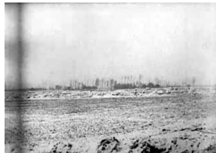
39a-f Titel und Einstellungsfolge aus MESSTER WOCHEN 1915, No. 9 (DE 1915)

zur Kameraposition im Zwischentitel übrigens als unplausibel erscheinen. Vielmehr muss bei dieser Simulation einer Fernaufnahme von einer gezielten Authentifizierungsstrategie der Filmemacher ausgegangen werden, die eine in Wirklichkeit wohl nicht vorhandene Gefahr für den Kameramann und die Frontnähe seiner Position suggeriert. Offensichtlich sollte hier vom Umstand abgelenkt werden, dass sich dieser Film (wie Wochenschauen im Allgemeinen) gerade durch das Fehlen von Aufnahmen aus den vordersten Linien auszeichnen. Wochenschauen enthielten üblicherweise weder authentische noch gestellte Kampfhandlungen von der Front; ihre gängigsten Sujets (Truppenbesuche, Nachschub, Freizeitaktivitäten, Artillerie, Kriegsgefangene, Ruinen etc.) liessen sich allesamt im rückwärt-