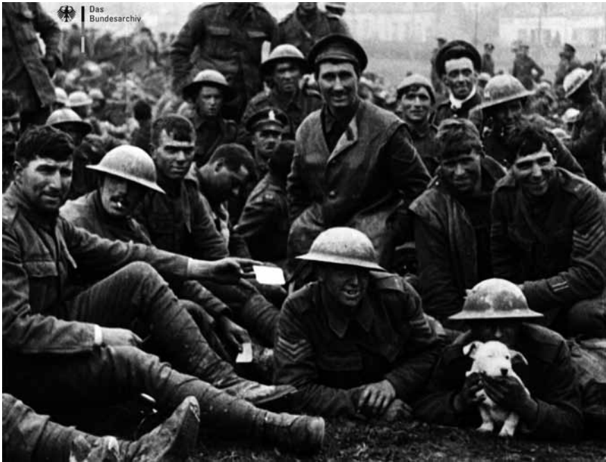
36 DIE ERSTEN AUFNAHMEN AUS DER SCHLACHT IM WESTEN (DE 1918)

WESTEN (DE 1918, BUFA). Der Streifen zeigt in seinen letzten Einstellungen am Boden ruhende, einigermaßen zufriedene britische Soldaten, die in recht naher Kadrierung mit einem Hundewelpen für die Kamera posieren.