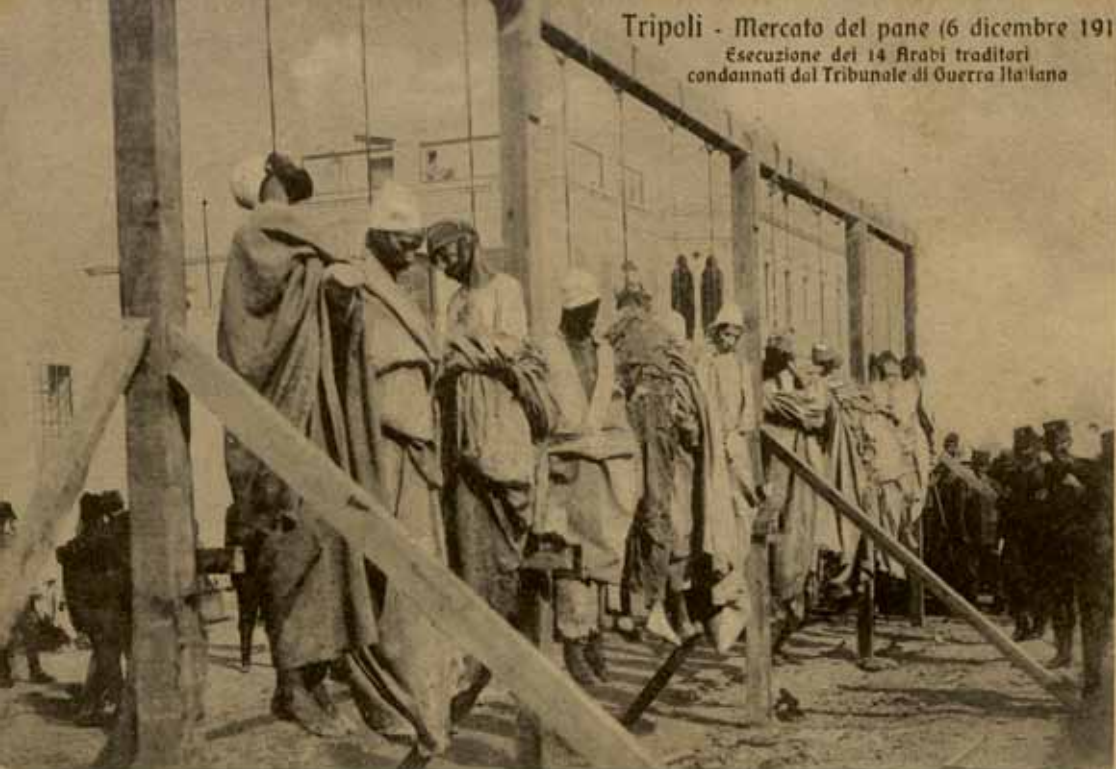
Tripoli - Mercato del pane (6 dicembre 1911) Esecuzione dei 14 Arabi traditori condannati dal Tribunale di Guerra Italiano