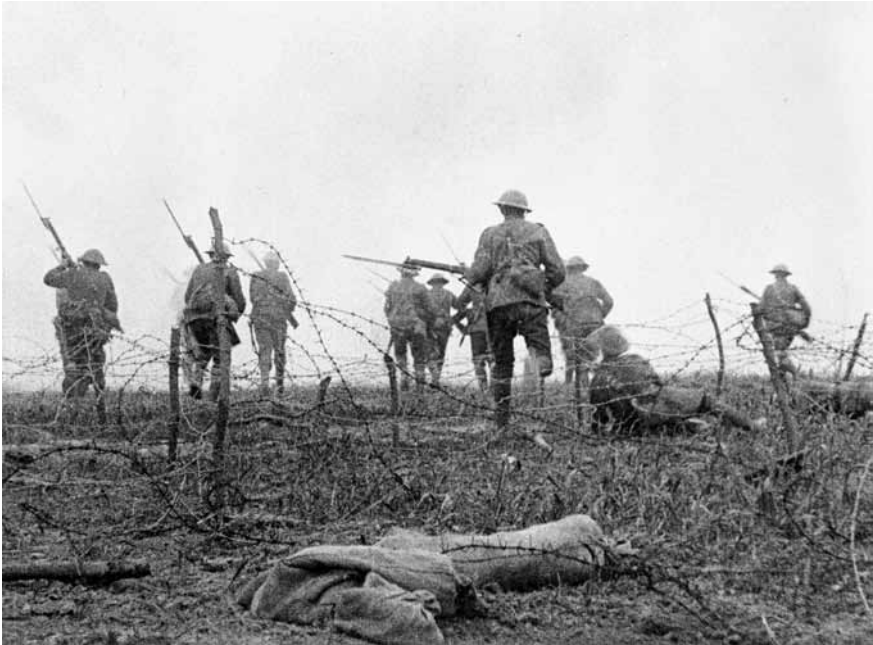
43 THE BATTLE OF THE SOMME (GB 1916)

SOMME beruhte indes auf gestellten Aufnahmen eines Infanterieangriffs (in der Abbildung die zweite Einstellung der Sequenz mit zusammenbrechenden Soldaten). Die für viele Zeitgenossen schockierenden Bilder trugen zum Authentizitätseindruck des Films und zu seiner internationalen Berühmtheit bei. 1881