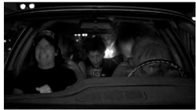
Abb.1: Headbangersequenz aus WAYNES WORLD