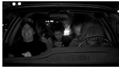
Abb.1: Headbangersequenz aus WAYNES WORLD