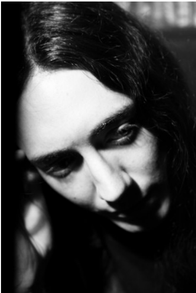
Abb.2: Alcest-Sänger Neige