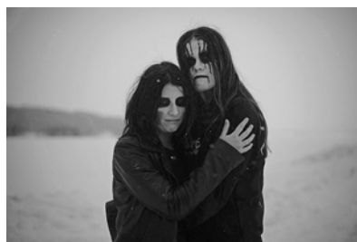
Abb.4 u. 5: Black Metal-FanArt mit »corpse paint«

Auf der Plattform flickr zeigt sich bei den Fotos, dass der »corpse paint« sehr verbreitet ist und sich ideal für die Platzierung im winterlichen Schwarz-Weiß-Raum eignet. Bei den gezeigten