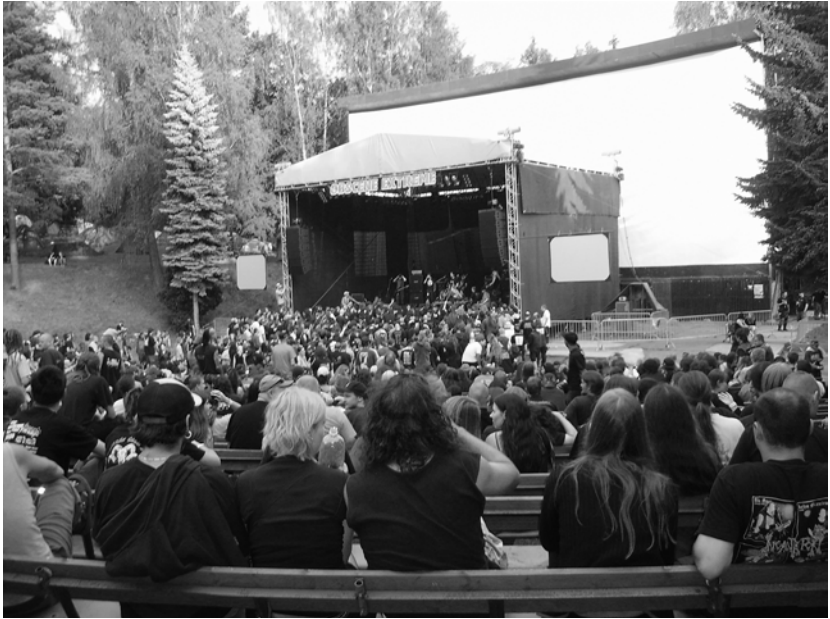
Abb.3: Foto vom Obscene Extreme 2006 Festival

Abgesehen vom diskurstheoretischen Naheverhältnis zu per se divergierenden Genres und dem somit erklärbaren Verständnis der Emergenz, lässt sich Grindcore als Schnittpunkt »multi(sub)kulturellen« Beisammenseins und Stilaustausches am diskursiv festgelegten, extremen Ende des Spektrums Metal/Punk sehen. Beispielhaft kann dies alljährlich auf dem »Obscene Extreme Festival« 61 (siehe Abb. 3) und dem »Play Fast Or Don't Festival« 62 in der Tschechischen Republik oder dem »Grind The Nazi Scum Festival« 63 in Deutschland in unterschiedlicher Intensität begutachtet werden, während sich diese Veranstaltungen allesamt dem heterogenen Konzept des Grindcore oder der metaphorisch benutzten Aussage »In Grind We Crust!« 64 unterordnen. Dort können sich die einzelnen gegenüberstehenden Kulturen (Metal/Punk) emergent begegnen und der dargebotenen Musik frönen, ohne dabei doktrinäre Glaubwürdigkeit einbüßen zu müssen.