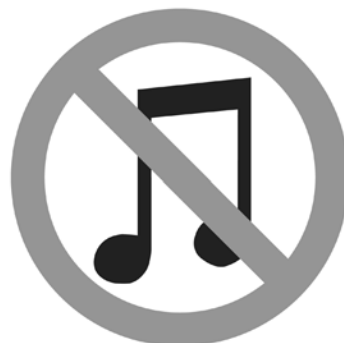
Abb.2: Attributierung mit antimusikalischen Symbolen