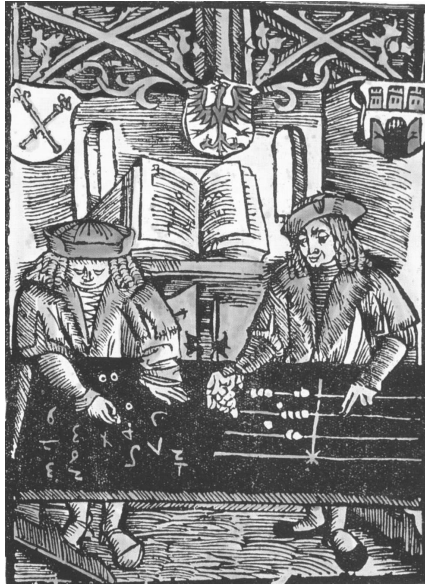
1 – Abakus versus schriftliches Rechnen

Eine dynamische Interaktion zwischen Menschen ermöglicht es, verständnisvoll und einfühlsam auf die jeweils aktuelle Problemlage einzugehen, hat aber den Nachteil mangelnder Dauerhaftigkeit (Persistenz). Äußerungen sind so schnell verflogen, wie sie kommen, und sind damit der Wahrnehmung zu einem späteren Zeitpunkt oder an einem anderen Ort nicht mehr zugänglich, es sei denn, man verwendet eine Aufzeichnungstechnik oder notiert Zwischenergebnisse symbolisch. Dynamische Interaktion und Persistenz stehen im Gegensatz zueinander. Dieser Gegensatz wird durch Technik verschärft.