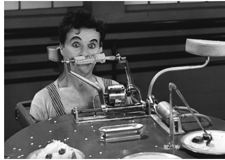
1 und 2 – Modern Times , 7. und 10. Minute

Soviel zu Bergsons lebensphilosophischer Kritik an den mechanischen Automatismen, die wegen ihrer mangelnden Sozialverträglichkeit durch die Gemeinschaft mit Gelächter beantwortet und bestraft werden. Und nun auch Schluss mit Charlie Chaplins so komischer wie satirisch bissiger Kritik an Automatisierungsprozessen, die das menschliche Subjekt zu einem fremdbestimmten Apparat degradieren und es dadurch in seiner Autonomie, seiner Lebendigkeit und seiner Würde verletzen. Kommen wir also zu unserer Hauptfrage nach der Marktthematik in Komödien und zur These vom Wirken einer unsichtbaren, sozial-integrativen Hand als Strukturhomologie zwischen Smithschem Marktoptimismus und Komödienhandlungen.