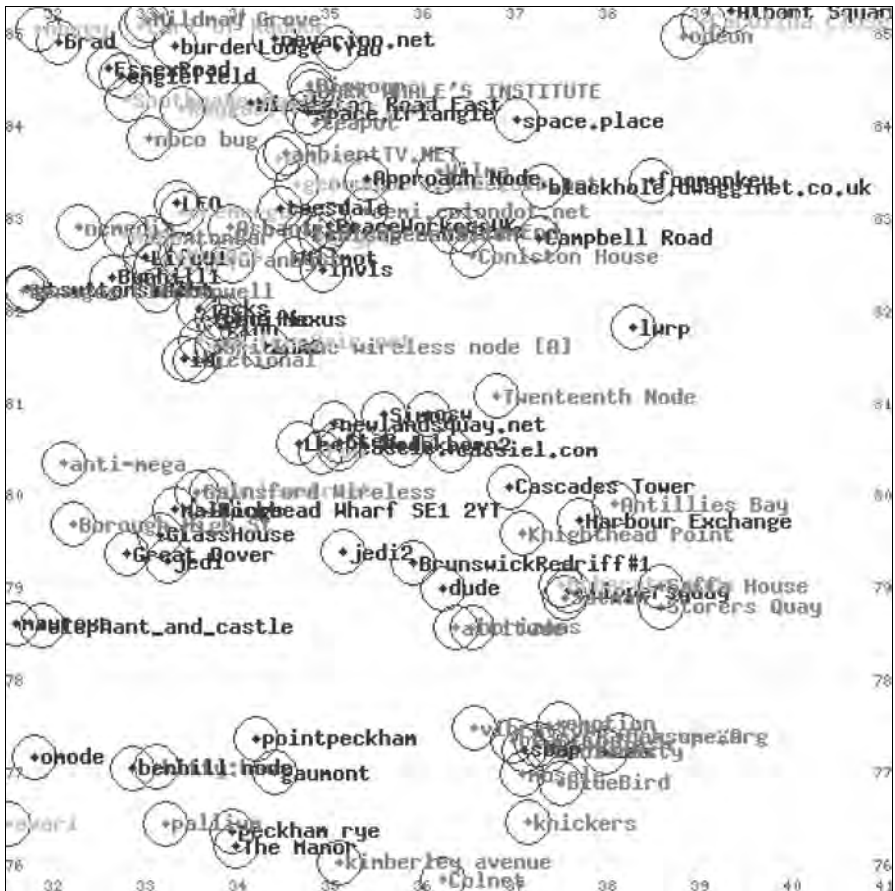
2 – Das Consume Net London am 21.4.2010 gegen 16 h. Diese Knoten sind vermascht. Nur wie? Siehe auch: http://nodedb.consume.net/nodedb.php

Der interessante Punkt lautet „by accident“. Dies stärkt meine Vermutung, dass es keine genealogische Linie von anderen Computer-Netzwerkformen zum Ad-hoc-Meshnetzwerk gibt. Das Phänomen stammt aus einer anderen Linie, die „by accident“ mit demselben Material arbeitet.