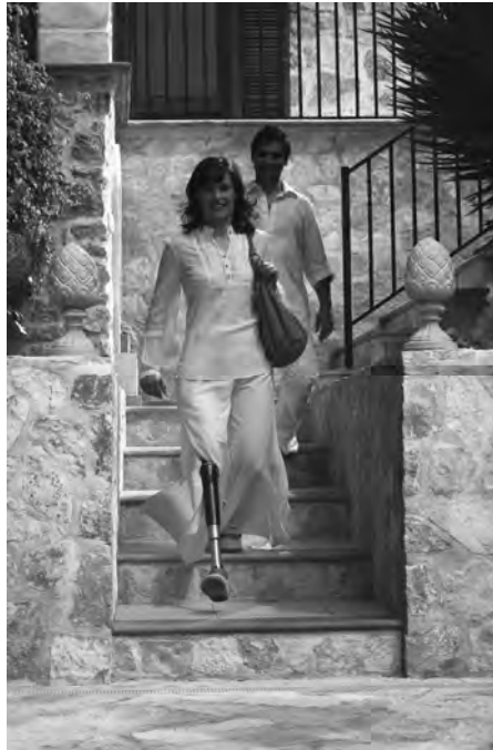
2 – Das PR-Foto des Prothesenherstellers Otto Bock zeigt: Auch Treppensteigen ist mit der Prothese wieder möglich

Sowohl auf ihrer Webpräsenz als auch in einem Imagevideo 47 präsentiert die Herstellerfirma das C-Leg als Wiederherstellung von Mobilität: „Mit dem C-Leg ist Aktivität wieder alltäglich.“ 48 Anders jedoch als bei den Automaten des 18. Jahrhunderts steht damit keine explizit aus der Maschine kommende Bewegung im Fokus. Stattdessen ist die Bewegung des gesamten Körpers im Raum von zentralem Interesse. Der Imagefilm betont diese raumorientierte Form der Bewegung, indem er Prothesenträgerinnen und -träger an Orten des Transits, wie dem Flughafen, aber auch in der Großstadt, zeigt.