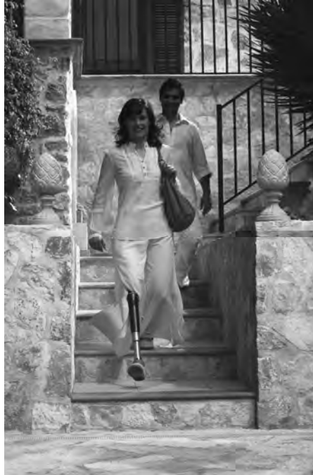
2 – Das PR-Foto des Prothesenherstellers Otto Bock zeigt: Auch Treppensteigen ist mit der Prothese wieder möglich

Sowohl auf ihrer Webpräsenz als auch in einem Imagevideo 47 präsentiert die Herstellerfirma das C-Leg als Wiederherstellung von Mobilität: „Mit dem C-Leg ist Aktivität wieder alltäglich.“ 48 Anders jedoch als bei den Automaten des 18. Jahrhunderts steht damit keine explizit aus der Maschine kommende Bewegung im Fokus. Stattdessen ist die Bewegung des gesamten Körpers im Raum von zentralem Interesse. Der Imagefilm betont diese raumorientierte Form der Bewegung, indem er Prothesenträgerinnen und -träger an Orten des Transits, wie dem Flughafen, aber auch in der Großstadt, zeigt.