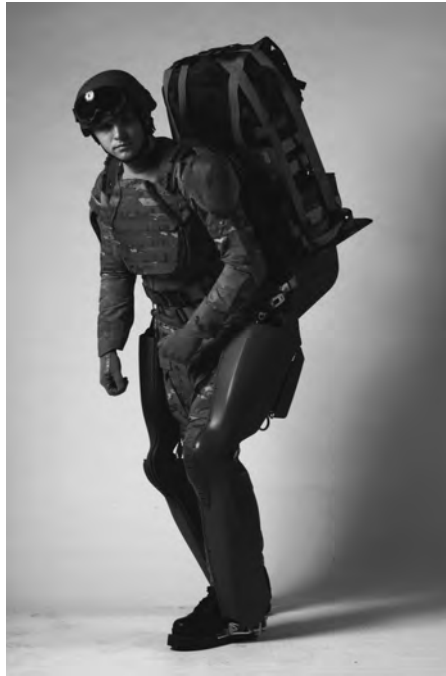
3 – Das Berkeley Lower Extremity Exoskeleton (BLEEX) erlaubt es Soldaten, über sich hinauszuwachsen

Doch Prothesen versprechen nicht nur Amputierten neue und erweiterte Bewegungspotenziale. Seit 2000 arbeitet das Berkeley Robotics and Human Engineering Laboratory der University of California gefördert durch die Defense Advanced Research Projects Agency (DARPA) des US-amerikanischen Verteidigungsministeriums an der Entwicklung eines Exoskeletts. Das Berkeley Lower Extremity Exoskeleton , kurz BLEEX 53 , soll es Soldatinnen und Soldaten ermöglichen, große Lasten durch unwegsames Gelände transportieren zu können. Ausgestattet mit mehr als 40 Sensoren soll das Exoskelett eine funktionale Symbiose mit dem Soldatenkörper eingehen, ohne dass dieser eine bewusste Steuerung übernehmen muss.