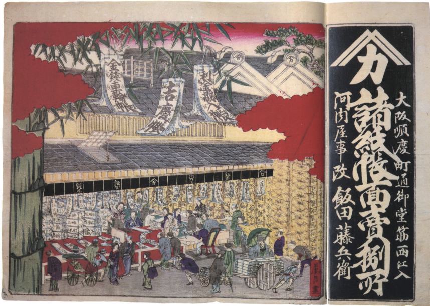
3 – Schreibwarenladen mit schwebenden, an Bambusästen hängenden Bücher- kanban ; rechts als Werbekalligrafie die Beschriftung „Alle Arten von Papierwaren“; undatierter Holzschnitt, Meiji-Zeit

tät der Ladenbesitzer einander beflügeln, zum anderen ein Massenmarkt für Güter entsteht. Für den japanischen Händler ( chōnin ) stellte der kanban ein ebenso wichtiges Symbol dar wie ein Militärbanner oder Wappen für den Samurai. 61