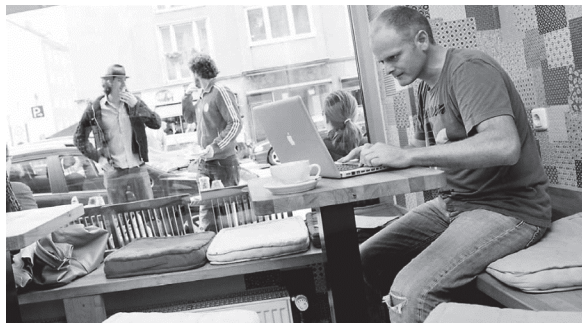
5 – Die Ablösung stationärer Computer durch Laptops führt zu einer flexibleren räumlichen Disposition.

„The internet in a cup“ überschreibt die britische Wochenzeitschrift The Economist im Dezember 2003 einen Artikel, der zu Internetcafés bereits kein Wort mehr verliert, aber doch deren medienkulturellen Wandel anzeigt. Nach dem Zusammenbruch der New Economy sei in „modern-day coffeeshops“ mit dem Web 2.0 nun eine „wireless fidelity“ 55 eingekehrt, die den Zugang zur medialen Infrastruktur zum zumeist kostenlosen Serviceangebot in Filialen von Fast-Food- und Kaffeehaus-Ketten sowie einer Vielzahl geschmacklich-gemütlich oder puristisch-futuristisch eingerichteter Szenecafés macht (vgl. Abb. 5). 56