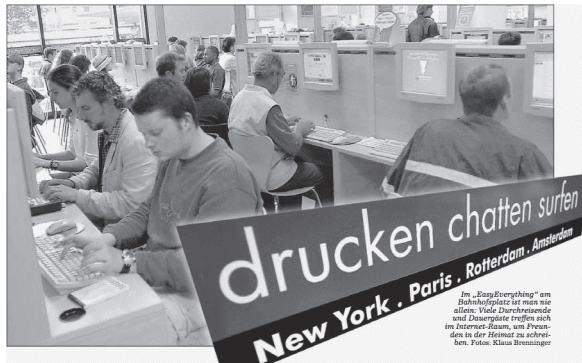
4 – In Reihen platzierte Flachbildschirme und die hinter Holzverkleidungen verschwundenen Computer sind kennzeichnend für die Filialen von EasyEverything , wie hier in München.