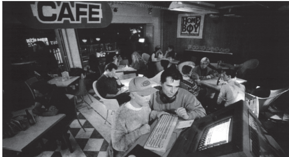
3 – Der JAM-Store in der Kölner Innenstadt verbindet Gastronomie und Medientechnik. Das Computerterminal im Vordergrund wird durch ein Metallgehäuse geschützt.

Glas, unter der ein Meer grüner Scherben liegt“ 46 sowie die „raffiniert in Tische aus edlem Holz eingelassen[en]“, flimmernden Bildschirme, die als gestalterisches Element hervorgehoben werden: „Grünes Neonlicht und leise Technosounds“ runden die atmosphärische Gestaltung ab. Zugleich wird die Möglichkeit erwähnt, einen „sichtverdeckten ‚Anfängerplatz‘“ aufzusuchen, womit MediennutzerInnen angesprochen werden, für die der Gang ins Café um die Ecke auch eine rite de passage im Umgang mit einer neuen Medientechnik ist.