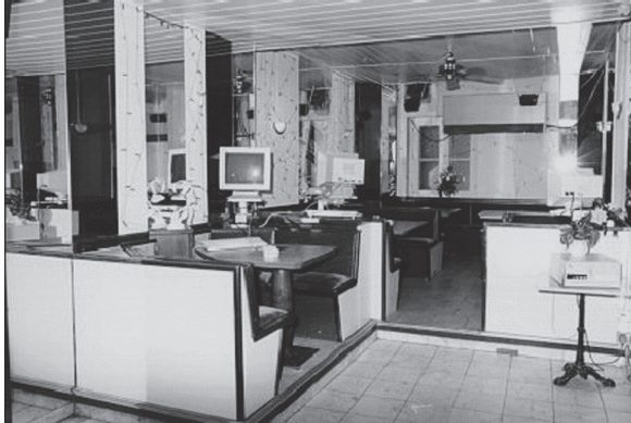
2 – Die Platzierung von Röhrenbildschirmen wird zum sichtbaren Zeichen einer Umnutzung bestehender gastronomischer Einrichtungen, wie hier in München.

Beim SFNet noch Zusatzangebot, zeichnete sich ab Mitte der 1990er-Jahre im Horizont der New Economy die Konstitution von Internetcafés als spezifischen Gebrauchskontexten ab, und es entwickelte sich ein regelrechter Trend, „in sein Stammcafé zu gehen mit dem Ziel ‚überall hinzufahren‘“ 37 . Hiermit verbunden werden Fragen der Repräsentativität von Einrichtung und Möblierung, die mit einer allmählichen Professionalisierung und Ökonomisierung einhergehen. Zunächst eher unspektakuläre Einrichtungen wie „runde Tische mit Gartenstühlen, eine Kaffeebar, Kabelgewirr an den Wänden“ 38 , wie im Londoner Cyberia , in dessen Umfeld sich auch die Bezeichnung als Cyber- oder Internetcafé durchsetzte, waren erste Internetcafés in Deutschland. Umnutzungen bestehender gastronomischer Einrichtungen, in denen Desktop-Computer „auf Spanplatten in einem Nebenraum [eines] 250 Jahre alten Gast-