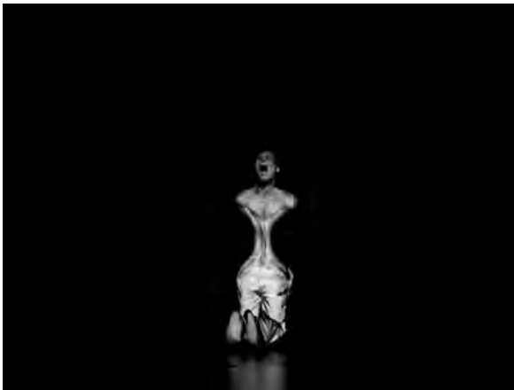
1 – Klaus Obermaier, D.A.V.E. , 1998

Die Verwendung von Körper und Raum als Bestandteile und Medien der Projektion kann z. B. wie in Apparition (2004) 47 aus der Interaktion mit ihr bestehen. Eine radikalere Version der Beziehung entsteht, wenn die datentechnisch erzeugten Bilder direkt auf die Körper der Performer projiziert werden, sie diese gleichsam mit ihren Körpern animieren und dabei untrennbar mit ihnen verschmelzen. Das Eine könnte ohne das Andere nicht sein. Während in D.A.V.E (1999) 48 die Körper der Tänzer immer als Projektionsoberfläche sichtbar sind, durch diese aber erweitert werden, verschwimmen in Vivisector (2000) 49 Körper und Projektion, so dass sie nicht mehr unterscheidbar sind.