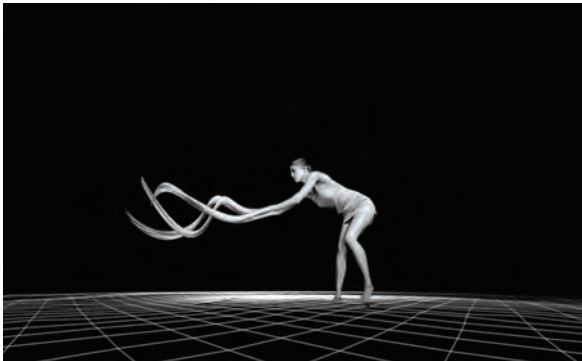
4 – Klaus Obermaier, Sacre du Printemps , 2006

Blutrote Farbschlieren beginnen einen rasenden Tanz. Umschlingen eine Frau, deren Gliedmaßen seltsam verzerrt wirken. Wie Spinnenarme greift es über unsere Häupter hinweg. Wie im Spiegelkabinett multiplizieren sich Beine und Arme. Bälle aus Körpern schießen durch den Raum. Lichtpunkte explodieren. Wie ein elastisches Drahtgeflecht wölbt sich ein Raster ins Publikum. 51