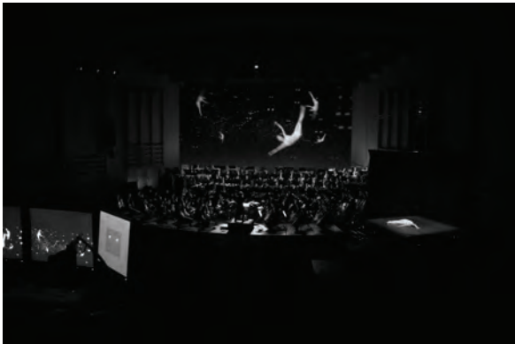
5 – Klaus Obermaier, Sacre du Printemps , 2006