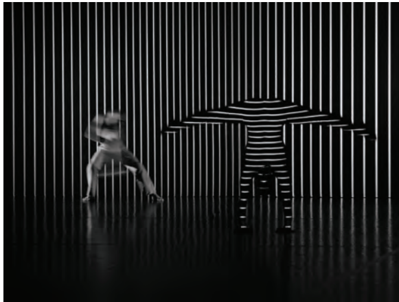
3 – Klaus Obermaier, Apparation , 2004