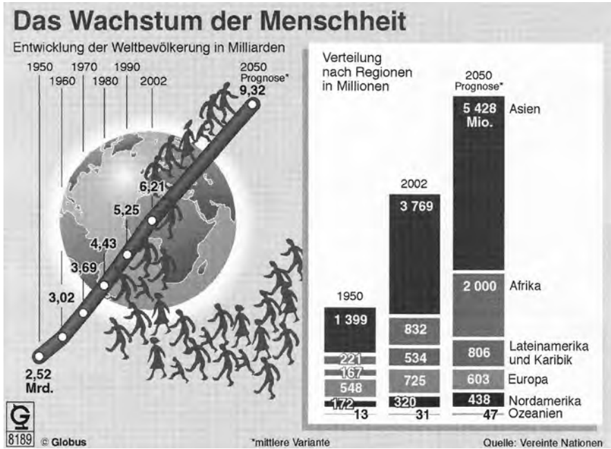
3 – „Das Wachstum der Menschheit“

Das Publikum liest eine solche Infografik routinemäßig als „Frühwarnung“, d. h. als Mitteilung, dass in einem bestimmten Bereich Denormalisierung (Verlust der Normalität) droht und also Normalisierungsbedarf (üblicherweise „Handlungsbedarf“ genannt) besteht. Offenbar gehört die Unterscheidung normal/anormal (bzw. nicht-normal) zu den konstitutiven Ordnungsprinzipien der heute ‚modernsten‘ Gesellschaftstypen. Im vorliegenden Fall bildet die Leiter nahezu eine steile Gerade, konnotiert also das alarmierend denormalisierende, symbolisch „exponentielle“ Wachstum und konnotiert demnach implizit den „Handlungsbedarf“, die Kurve spätestens etwa ab dem Punkt, wo sie den Globus verlässt, in Richtung Horizontale (Nullwachstum) ‚zurückzubiegen‘. Wie das geschehen könnte, bleibt völlig ungesagt und unkonnotiert. Klar ist jedenfalls, dass es kaum „automatisch“ in einem strengen Sinne erfolgen kann.