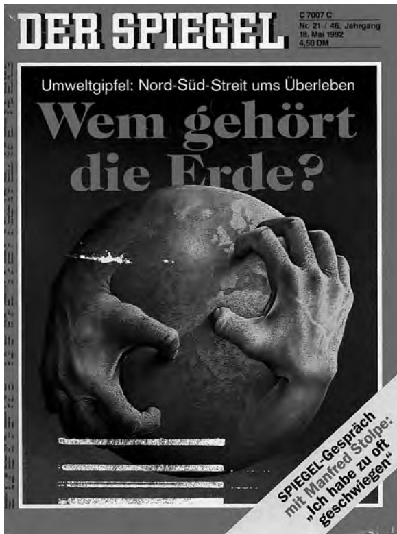
6 – „Wem gehört die Erde?“

Es dürfte nach den bisherigen Ausführungen einigermaßen plausibel sein, anzunehmen, dass bei statistisch relevanten Teilen des Publikums auf der Basis der eng verwandten und kontinuierlich stereotyp reproduzierten Kollektivsymbolik eine Kopplung zwischen den Geschichten von der Bevölkerungsexplosion, vom Geburtendefizit und von der Einwanderung ‚einrasten‘ wird. Dies um so eher, als wir es in allen drei Fällen mit exemplarisch normalistischen Geschichten zu tun haben: In allen drei Fällen ist die Geschichte auf statistische Daten gestützt, so dass die subjektive Denormalisierungsangst ‚objektiv‘ untermauert wird. In allen drei Fällen vermitteln die Medien sehr ähnliche Kombinate von symbolisch „exponentiellen“ Infografiken und alarmierender Kollektivsymbolik massenhafter Explosionen, Fluten und Invasionen.