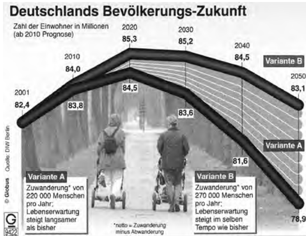
1 – „Deutschlands Bevölkerungs-Zukunft“

Zunächst einiges Anschauungsmaterial (vgl. Abb. 1):