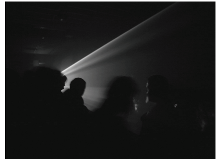
1 und 2 – Anthony McCall, Line Describing a Cone , USA 1973

Der filmische Automat, die filmische Technologie des 19. Jahrhunderts, die im Verhältnis zu digitalen Medien als beeindruckend stabil gelten kann, entstammt nicht zufällig dem größeren Zusammenhang der Erforschung ‚kybernetischer‘ 4 , kinetischer und psychischer Abläufe und Automatismen. Der Einsatz von Filmapparaturen war nicht nur Grundlage der Bewegungsstudien von