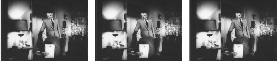
6, 7 und 8 – Martin Arnold, Pièce Touchée , USA 1990

in Bildern erzählt wird, ändert. Ist es nicht eher so, dass das Experiment damit endet, dass eine andere Geschichte erzählt wird?