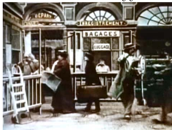
Figure 2. Der Bahnhof: Sinnbild der Zeitformatierung im Zeichen der Raumerschließung.

nebeneinander standen, deren jeweils ‚eigene‘ Zeit (die sie im Zug ‚transportiert‘ hatten) nicht der Ortszeit des Bahnhofs entsprach!! Flemings Einsatz ist es zu verdanken, dass sich im Oktober des Jahres 1894 eine internationale Kommission ‚Zeit für die Zeit‘ nahm. Diese fasste den folgenreichen Beschluss, eine allgemein verbindliche Weltzeit einzuführen: Als Nullmeridian wurde der Längengrad der englischen Sternwarte in Greenwich festgelegt, ferner einigte man sich auf 24, jeweils um eine Stunde voneinander entfernte Zeitzonen. Seither beginnt der Welttag um Mitternacht am Meridian von Greenwich. Alle anderen Zeiten der Welt werden in einem verlässlichen Plus-/Minus-Verhältnis zur GMT angegeben.