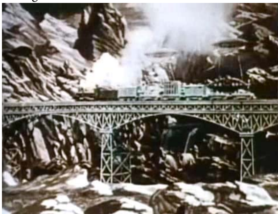
Figure 3. Die modernen Transportmaschinen überwinden Zeit und Raum.

Eine der Folgen vehikularer Beschleunigungstendenzen im 19. Jahrhundert wurde als die ‚Schrumpfung des Raums‘ bezeichnet: In kürzerer Zeit konnte nun mehr Strecke zurückgelegt werden. Entsprechend befindet sich der Zug, den die Filmreisenden bestiegen haben, schon im nächsten Tableau in einer Gebirgslandschaft.