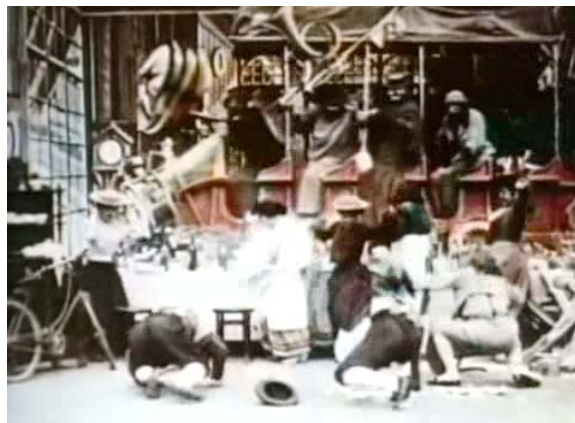
Figure 4. Implosion der Räume: in die Lokalität bricht der Fortschritt, das Gewohnte wird zerstört.

cher Ausdehnung, wurde zur damaligen Zeit größtenteils als Fortschritt begrüßt, aber auch als Irritation erfahren. So spricht Heine 1843 anlässlich der Eröffnung der Eisenbahnlinien von Paris von der ‚Tötung des Raums‘ 44 , die die neue Verkehrstechnik mit sich brächte. Zugleich, so Heine, „erfasst den Denker ein unheimliches Grauen, wie wir es immer empfinden, wenn das Ungeheuerste, das Unerhörteste geschieht.“ 45 Der Bildgehalt des Lexems ‚unheimlich‘, das Heine in Bezug auf den technischen Fortschritt verwendet, erfährt in LE VOYAGE À TRAVERS L'IMPOSSIBLE Veranschaulichung. Als der im Auto fahrenden Forschergesellschaft ein Haus im Weg steht, lässt sie sich von diesem Hindernis nicht dazu nötigen, Zeit zu ‚verschwenden‘, indem sie dem Objekt in einer Kurvenbewegung ausweicht. Das Tal als räumliches Hindernis der Tiefe wurde mit Hilfe einer Brücke auf die Zweidimensionalität reduziert. Dieses ‚zur Strecke bringen‘ des Raums wiederholt sich im Fall des in die Höhe ragenden Hauses; wieder wird der kürzeste Weg zwischen zwei Punkten realisiert: Der Linearität vektorieller Bewegung folgend durchbricht das Auto die vordere und hintere Wand des Hauses und durchtunnelt das Gebäude. Die traditionelle Gemeinschaft, die sich in der Lokalität beim Essen befindet, wird von der über sie jäh hereinbrechenden Technik überrascht.