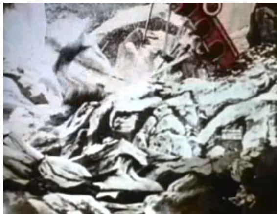
Figure 5. Technik außer Kontrolle: Tollkühne Forscher in ihrer verunglückten Kiste.

schaftler aufgenommen wird, folgt das Unglück. Die Auge-Fuß Motorik, die die Bedienung der Bremsen gewährleistet, kann mit der Geschwindigkeit nicht Schritt halten. Die Beschleunigung gerät außer Kontrolle, das Auto stürzt einen Abhang hinunter und zerbricht, die Reisegesellschaft im Auto hat sich als Besatzung eines Narrenschiffs erwiesen. Nach dem erfolgreichen Überqueren des Tals und dem Durchqueren des Hauses, deutet sich in diesem Bruch erstmals eine Begrenzung des Fortschrittsvermögens in und durch Technik an.