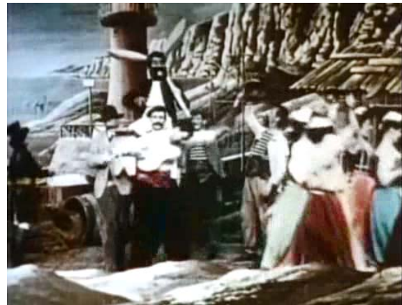
Figure 9. Technischer Fortschritt als Sozialutopie: Tradition und Moderne arbeiten Hand in Hand.

Im letzten Tableau werden die an den Ausgangsort ihrer Reise zurückgekehrten Expeditionsteilnehmer feierlich empfangen. Die Befahrung des Weltalls hat sich als möglich, aber nicht als lohnend erwiesen. Die Beurteilung der eigenen Lebenswelt und das Akzeptieren ihrer Zustände kann dadurch umso positiver ausfallen.