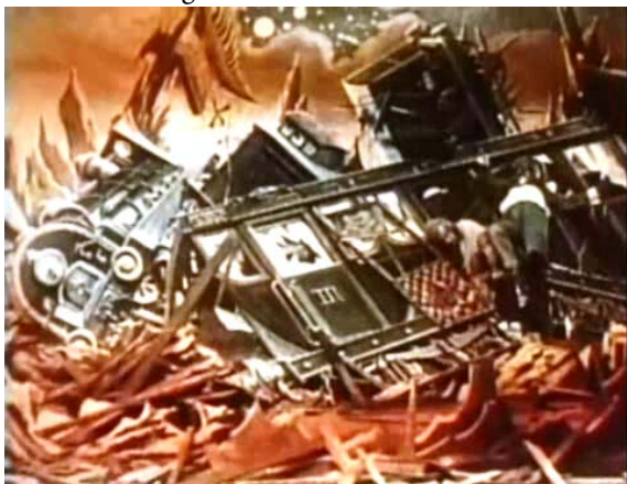
Figure 7. Gestrandet in der Heliosphäre: der erste ‚Raumschiffbruch‘ der Filmgeschichte.

Das Vorhaben der ‚Gesellschaft für inkohärente Geographie‘, die Sonne in den Bereich des Bekannten einzubinden, kohärent zu machen, bildet den Höhe- und Wendepunkt der Filmerzählung. Das nächste Tableau zeigt, wie der Raumzug in die Szenerie der Sonnenoberfläche stürzt und beim Aufprall zu Bruch geht. Betrachtet man das Zugmodell als Raumschiffmodell, so ist hier der erste Raumschiffbruch der Filmgeschichte zu sehen.