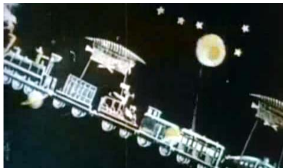
Figure 6. Nächster Halt ‚Sonne‘: der Zug als Proto-Raumschiff.

Diente in LE VOYAGE DANS LA LUNE noch der nah gelegenen Mond als Reiseziel, wird in LE VOYAGE À TRAVERS L'IMPOSSIBLE die um hundertfünfzig Millionen Kilometer weiter entfernte Sonne angefliegen. Ein Teil der filmischen Erzählung widmet sich der Ausgestaltung der Reise dorthin. „Das Weltall hat in diesen Satiren auf die ‚Geschwindigkeitsräusche‘ der Zeitgenossen noch etwas anheimelnd Überschaubares; es ist nichts weiter als die Fortsetzung unserer Atmosphäre, in der dieselben Gesetze gelten wie auf der Erde.“ 53 Der Zug, getragen von den Ballons, fliegt vorbei an Planetenmodellen, Sternen und Kometen. Ein Meteoritenschauer vervollständigt das Bild. Die ‚Landschaft‘, die der Filmzuschauer mit dem Kauf der Kinokarte erworben hat, ist kosmisch, der Flug hindurch ästhetisches Erlebnis.