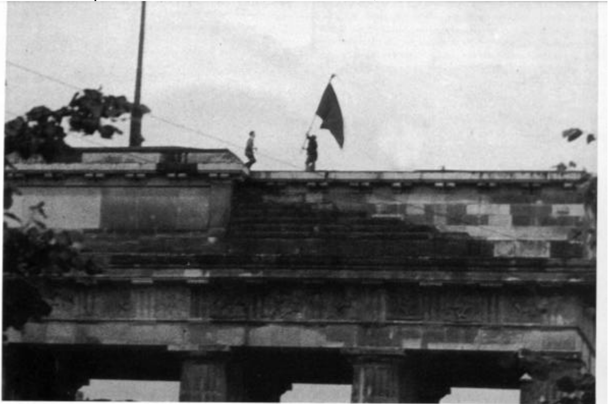
17. Juni 1953: Die rote Fahne wird vom Tor geholt

gleichsweise groben Körnung des Photos und aus dem unscharfen Fahnenrand Hinweise auf die Retusche; denn es ist sehr schwer, mit dem Deckfarbenpinsel wirklich scharfe Ränder zu zeichnen,