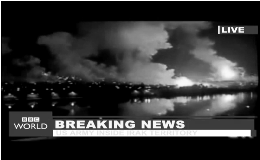
Abb. 3 Screenshot BBC (21.03.2003)