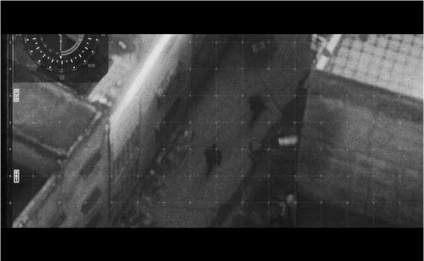
Abb. 1 Screenshot Green Zone