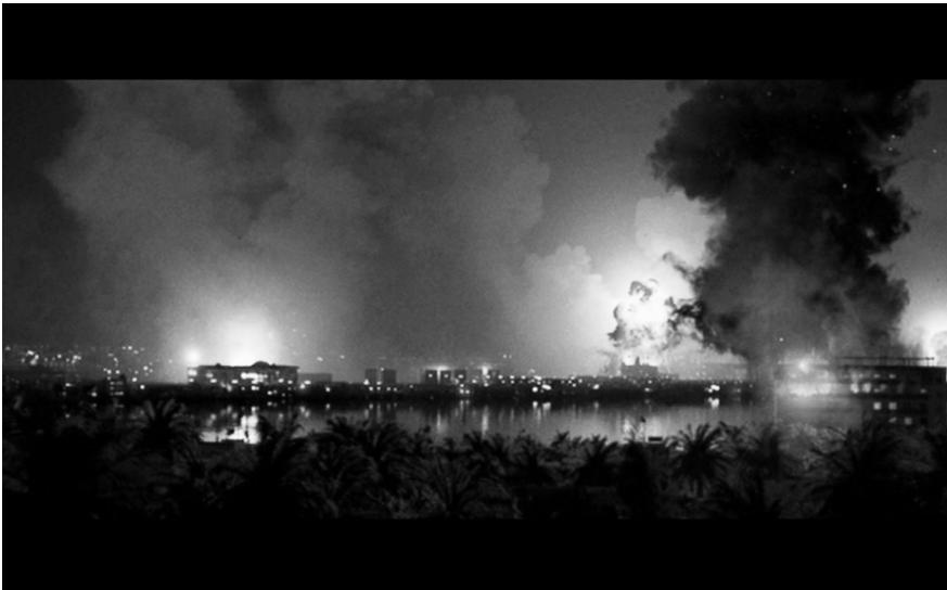
Abb. 4 Screenshot Green Zone