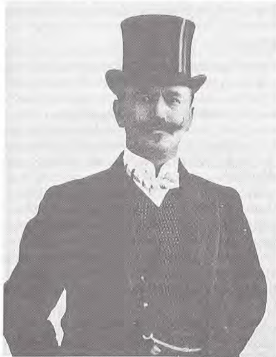
Abb. 4: F.A. Nöggerath Sen.

seine Assistenten hatten bald den Ruf, die Öffentlichkeit besonders schnell mit berichtenswerten Ereignissen aus dem In- und Ausland zu versorgen. Seine Position als Lokalheld geht eindeutig aus der Entrüstung eines Journalisten hervor, als Nöggerath die beträchtliche Summe von einhundertsechzig Gulden bezahlen mußte, um seine Kamera bei der Beerdigung