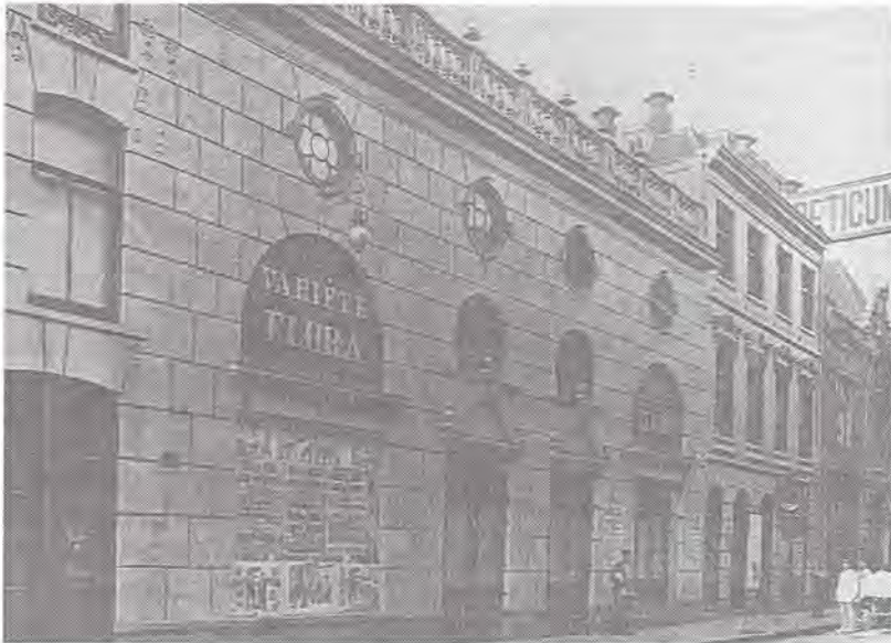
Abb. 5: Flora Theater 1900

bewiesen hatte, daß er dazu in der Lage gewesen wäre. Das Publikumsinteresse an „frischen“ Bildern wird mit anderen Worten in bestimmten, zweckmäßigen Situationen stimuliert und bedient, deren Breitenwirksamkeit praktisch garantiert ist (wie zum Beispiel bei wenig kontroversen Gegenständen wie etwa der niederländischen Königsfamilie oder dem Burenkrieg).