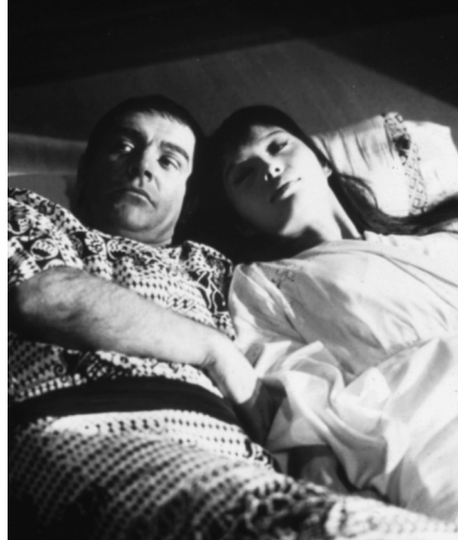
Akiko Wakabayashi als Schöne in Bonds Arm – solche Bilder werden gerne für die Werbung freigegeben – YOU ONLY LIVE TWICE (GB 1967).

Durch das geglättete Image erreichte Bond ein größeres Publikum, es macht Bond auch zu einem besseren Werbeträger. Mit Bond als Werbeträger für luxuriöse, technisch hochwertige Waren und für männliche Accessoires ließ sich nicht nur Geld verdienen; Bond als Werbemagnet war immer auch für sich selbst unterwegs (vgl. Hügel 1998 b, 207ff). Jede Rolex-Werbung, jeder Satz „Bonds Choice“ (z.B. FAZ v. 26.3.1999, 4) hält die Uhr und die Filmfigur präsent und gibt ihr Kontinuität im kulturellen Gedächtnis, wenn der Film schon lange ab-