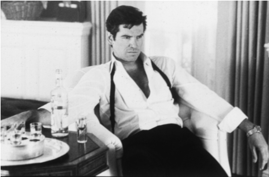
Bond (Pierce Brosnan) in der Rolle eines Philip Marlowe – TOMORROW NEVER DIES (GB 1997).

His last action was to slip his right hand under the pillow until it rested under the butt of the .38 Colt Police Positive with the sawn barrel. Then he slept, and with the warmth and humour of his eyes extinguished, his features relapsed into a taciturn mask, ironical, brutal, and cold (Fleming 1955, 10).