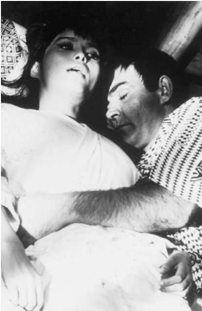
Bond (Sean Connery) in den Armen einer Toten (Akiki Wakabayashi), die für ihn gestorben ist – YOU ONLY LIVE TWICE (GB 1967).

Bond als Verwandten D'Artagnans zu annoncieren. Daher kann Bond einerseits zu seinem Körper ein glaubwürdiges Verhältnis herstellen als die Mantel- und Degen-Fechter, die den Gesetzen der Physik kaum unterworfen zu sein scheinen. Andererseits strahlt er wie einer der drei Musketiere Optimismus und Zuversicht selbst in Situationen größten Ernstes und größter Not aus. Umgekehrt schützt wiederum das Mantel- und Degen-Erbe Bond davor, daß seine Aktions- und Kampfauftritte ins Brutale abrutschen.