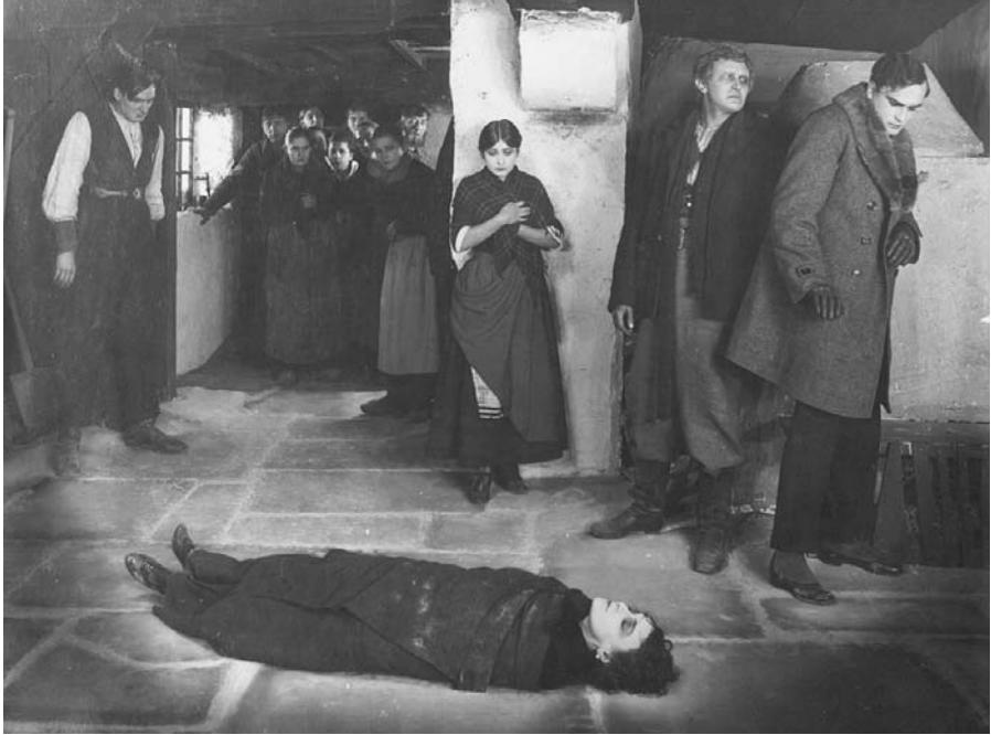
Abb.3: DER BRENNENDE ACKER: Bauern und Aristokraten in Neubabelsberg