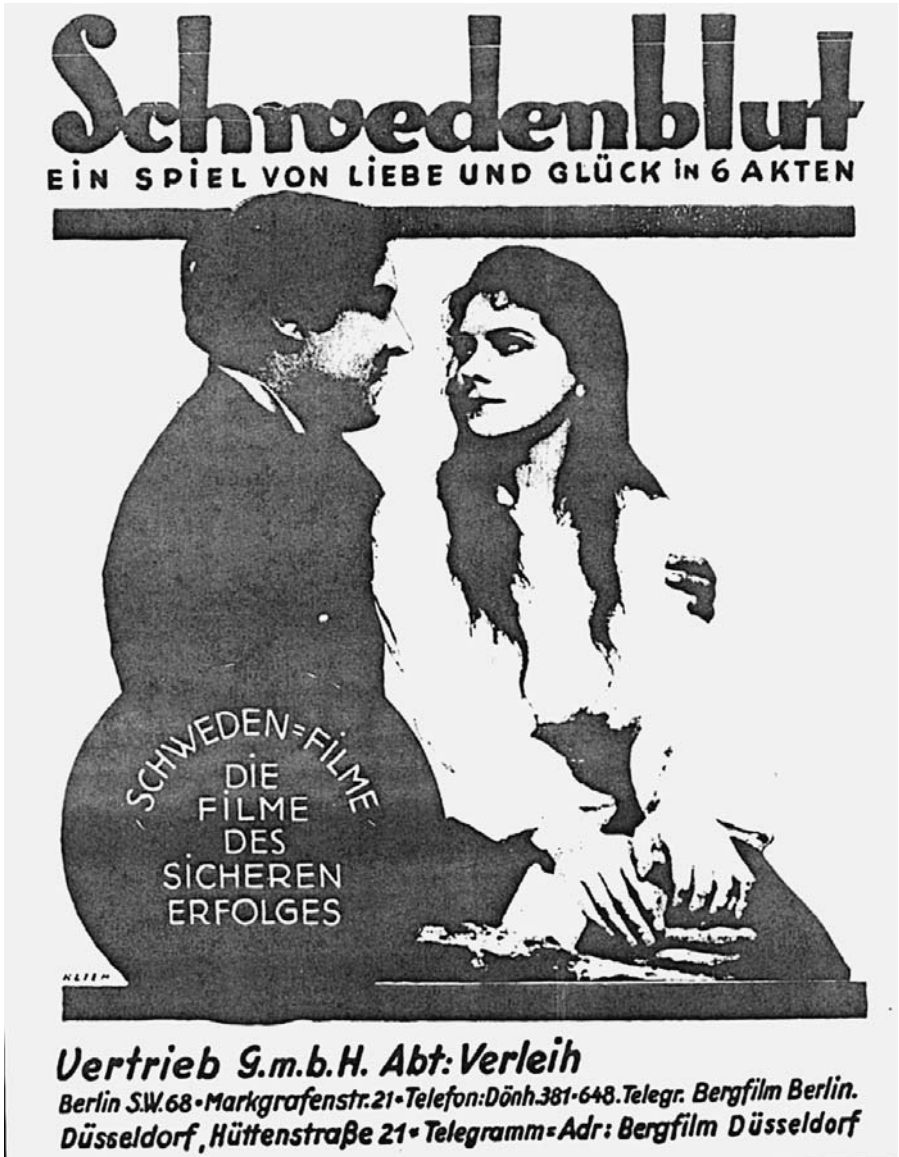
Abb.1: HÄLSINGAR (1923): Anzeige des Filmverleih Rudolf Berg