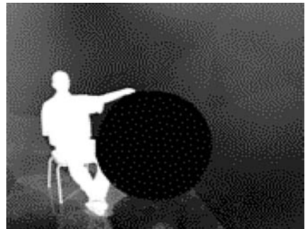
Abb. 1: Einzelne Bildkomponenten des virtuellen Studios und Gesamtbild GMD-Projekt The Virtual Studio ( www.viswiz.gmd.de )

gen, die dabei erbracht werden müssen, sind um ein Vielfaches höher als diejenigen, die für das traditionelle Blau-Stanz-Verfahren benötigt werden. Für Fernseh bewegtbilder muss die Bildeinstellung der einzelnen Kameras in Verbindung mit den im Computer gespeicherten Raumelementen (virtuelle Dekoration, dreidimensionale bewegte Grafiken etc.) 24 bis 30 Mal pro Sekunde neu berechnet werden ( frames per second ). So entsteht jeweils das aktuelle Nachrichtenszenenbild.