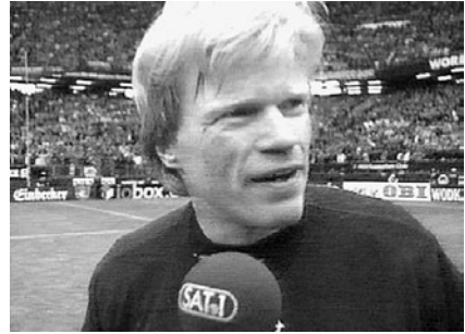
Abb. 6 und 7 „Dinge, die kann man gar nicht erklären.“

schende Ereignisse. Gleichzeitig gibt es Kamerastandpunkte, die gezielt Emotionsformen einfangen sollen: Bilder auf ausgewählte Personen mit besonderem Bezug zum Ereignis; die Hubschrauber- oder Ballonkamera mit der Aufsicht auf das Stadion; eine Zuschauerkamera, die auch die „La-ola“-Wellen einfangen kann. 7