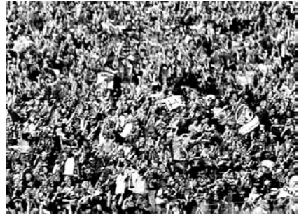
Abb. 15 und 16 „Sie alle, sie haben es verdient.“

Oft wird das zu bejubelnde Ereignis psychologisiert und historisch kontextualisiert: „Unglaublich, der ganze Stress, der Druck, er löst sich auf. [...] Sie alle, sie haben es verdient, und auch sie, die Fans des FC Schalke 04.“ Das Fernsehen verfolgt insbesondere in der kontextuellen Berichterstattung eine Ethnologisierung , indem sie das Jubeln und Feiern unterschiedlicher Bevölkerungsgruppen und Fankulturen vergleichend inszeniert. Szenen aus Kneipen, Kleingärten sowie elementare Kulturtechniken wie Essen und Trinken werden durch die ethnologische Kamera beobachtet.