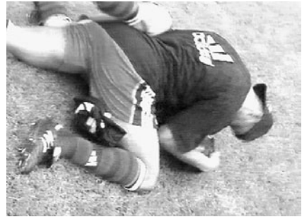
Abb. 13 Die Kamera jubelt.

Anstelle der Verdichtung des Spielverlaufs tritt nun das Exzessive des Feierns und Jubelns in den Vordergrund. Das Ereignis, so könnte man sagen, wird abstrakter: es ist nur noch adäquater Anlass für den Exzess. Das Feiern dagegen wird konkreter: es verweist nicht mehr auf seine Ursache, sondern präsentiert sich selbst. „Aber wen hält es jetzt noch an dem ihm zgedachten Ort?“; „Und jetzt hält es sie nicht mehr, sie strömen rein“ und das Stadion ist ein „einziges Riesenland der Freude“ (Abb. 10–13). In diesem Zusammenhang finden sich auch die wenigen Versuche, mit der Kamera den Jubel visuell umzusetzen und in einer wenig avantgardistischen und mehr isomorphischen Weise in den Jubel einzutauchen.