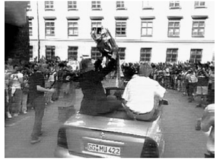
Abb. 1 und 2 Das Jubeln als media event

ihre Räder gestützt, die Ergebnisse eines Radrennens diskutieren gehört haben, um sich das Verständnis dieses Tatbestands zu eröffnen. (Benjamin 1977, 155)