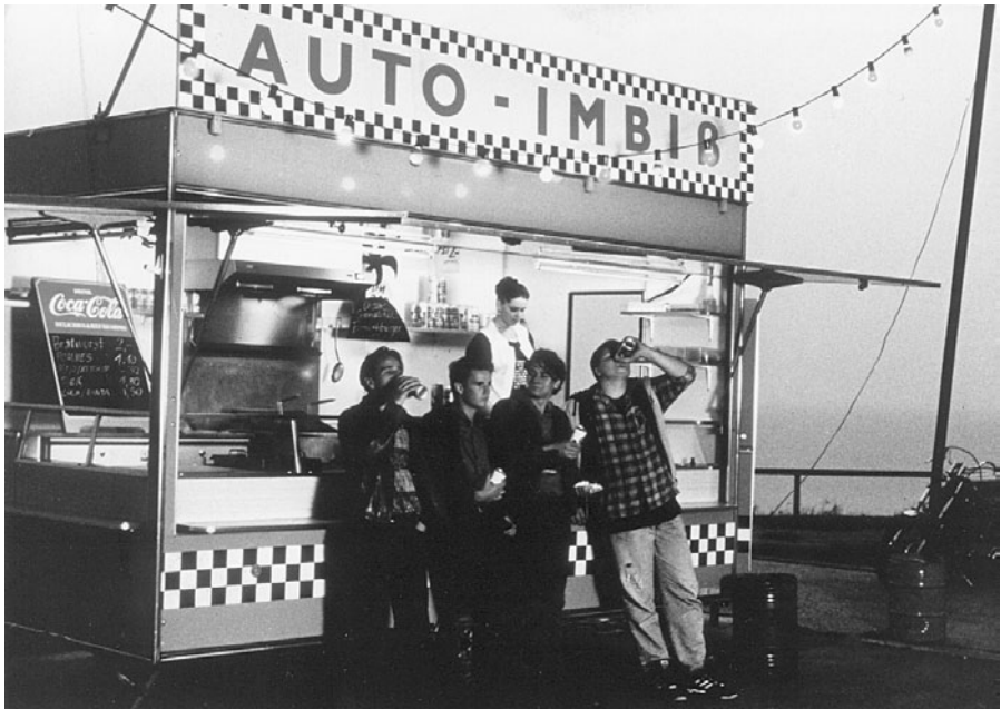
FRANKIE, JONNY & DIE ANDEREN (Deutschland 1993, Hans-Erich Viet)