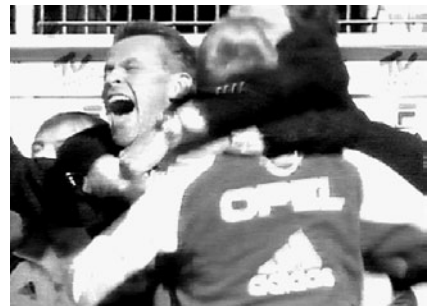
Abb. 3–5 „Und sie jubeln was das Zeug hält.“

den, um in der Serialität des Fernsehsports immer wieder neu den besonderen Anlass und die besondere Ausdrucksform des Feierns plausibel zu machen. Das spezielle Augenmerk liegt darauf, wie der Exzess des Jubels herausgestrichen und dabei zugleich in die fernsehtypische Diskursivierung überführt wird. Im Einzelnen haben wir es immer mit komplexen Bild-Ton-Relationen zu tun, die wir aufgelöst haben, indem wir zuerst auf die Visualisierungen und dann auf die dominant sprachlichen Verfahren eingehen. 6