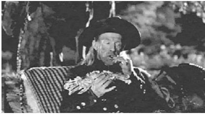
Abb.1 Drei Hände ...

im Campingsessel 13 am Lagerfeuer sitzt; sein Pferd steht malerisch hinter ihm im Wald. Cole nagt an etwas, das wie ein gebratenes Kaninchen aussieht, greift sich zwischen die schneeweißen Zähne, spuckt Knöchelchen aus, leckt sich die Finger. Erst als er das Stück ein wenig dreht, pendelt plötzlich eine schlaffe Hand nach unten, die bereits ziemlich zerrupft und zernagt aussieht, und hebt sich für einen kurzen Moment deutlich ab: Die Schwarzweißfotografie entmaterialisiert zwar das Fleisch zu einem hellen Objekt, aber betont auch die Umrisse (Abb. 1). Jarmusch lässt uns Zeit, fordert uns durch die Dauer der Einstellung auf zu warten, bis visuelle Gewissheit herrscht. Besonders beunruhigend wirkt sich aus, dass nun drei Hände im Bild sind, alle etwa identisch groß. Außerdem brät am Spieß noch ein größeres Stück, das nicht näher gezeigt wird.