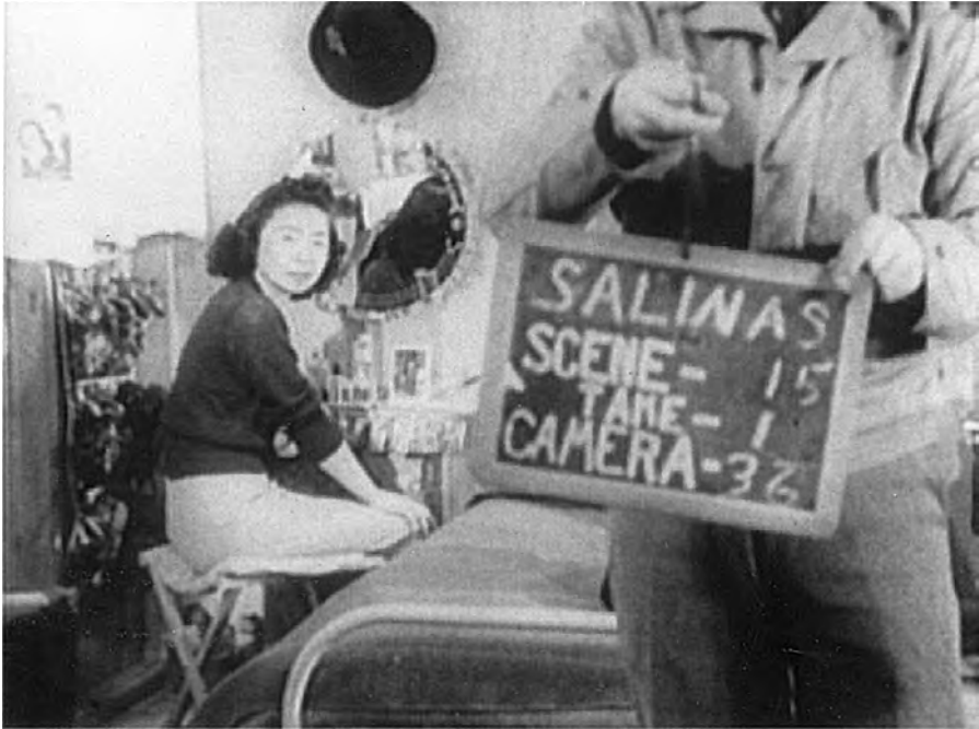
Abb. 5 Dreh eines Propagandafilms im Internierungslager von Salinas.

Doch genauso will das Video, das als audiovisuelles Medium innerhalb des Reiches des Sicht- und Hörbaren angesiedelt ist, andeuten, dass es ‚Artefakte‘ gibt, die sich diesem Reich entziehen, was in den oben erwähnten ‚Prämissen‘ des Werkes deutlich wird. Das, was als erstes in dieser Videoarbeit zu sehen ist, ist gar kein Bild, sondern dessen Ersatz: ein rollender Text, der eine ungebildete und daher beinahe verlorengegangene Geschichte in seinem vermuteten Ablauf präsentiert, in der Form eines mentalen Bildes, das der Zuschauer selbst erfinden muss. Mehr bleibt nicht übrig. In diesem Bild wird der Ausgangspunkt des Werkes als Symptom eines Traumas deutlich: Die Geschichte beginnt mit den Alpträumen der Sprecherin selbst, als Mädchen am 20. Jahrestag des Angriffs auf Pearl Harbor, der als Anfangspunkt des kollektiven Leidens identifiziert wird.