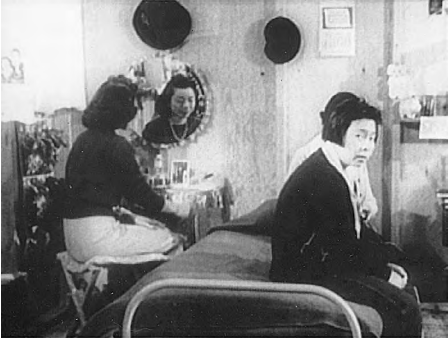
Abb. 4 Frauen im Internierungslager von Salinas.

darstellen lässt, wenn man sich auf die vorhandenen dokumentarischen Materialien verlässt.