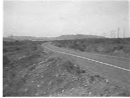
Abb. 3 Umgebung des Internierungslagers in Poston.

zu durchqueren, um die Erinnerung z. B. an die Punkte eines rhetorischen Arguments zu wecken. Notwendig ist eine solche Kunst in einer schriftlosen Kultur oder einer Kultur mit erschwertem Zugang zu Schriften.