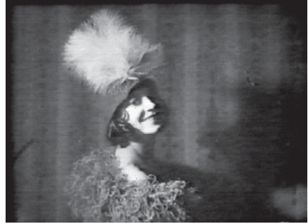
Abb. 3 Asta Nielsen in DIE BÖRSENKÖNIGIN (D 1918)

Neben solchen betont diskontinuierlichen Arrangements ist auch das Bemühen spürbar, trotz dominanter Starpräsentation und Wahrung des