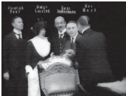
Abb. 5.1–5 Wo ist COLETTI?

xes Beispiel dieser Art. Der Prolog besteht aus mehreren Einstellungen, hat deutlich über zwei Minuten Länge und nutzt intensiv Animationstechniken. Der Autorenfilm-Strategie folgend, erscheint – durch einen Zwischentitel angekündigt – zunächst Franz von Schönthan, der Autor, an einem Schreibtisch frontal vor der Kamera sitzend. Er nimmt einen Anruf entgegen, zeigt die Pose eines Geistesblitzes und beginnt lächelnd (Komödie!) zu schreiben. Bis zu die-