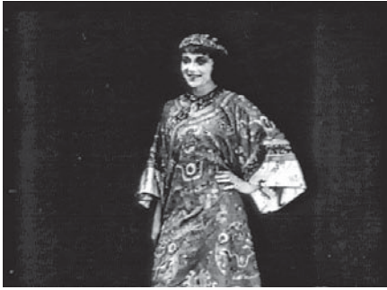
Abb. 2 Asta Nielsen in DIE VERRÄTERIN (D 1911/12)

den Personen vor, sondern führten jetzt auch die bislang unerwähnten Namen der wichtigsten Schauspieler auf. Der Star fand dabei besondere Hervorhebung, zumindest erschien sein Name größer gesetzt als die anderen, vielfach erschien er sogar auf einem gesonderten Zwischentitel. Daran schloss sich dann sehr häufig eine Einstellung an, die im erläuterten Sinne Prolog-Charakter besitzt, also nicht in die Handlungswelt integriert, sondern diskontinuierlich ange-