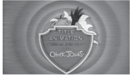
Abb. 5.1 und 5.2 GREMLINS 2: THE NEW BATCH