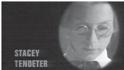
Abb. 1.1–3 LES DEUX ANGLAISES ET LE CONTINENT

(DAS PHANTOM IM PARADIES, USA 1974, Brian de Palma) (vgl. Abb. 2.1 und 2.2). Diese schlichte Doppelung lässt dem Zuschauer die Wahl zwischen dem Heimweh nach der Figur, das die Identifikation und den Glauben über die Grenzen der Erzählung hinaus verlängert, und der rückblickenden Bewunderung für die «Leistung» des Schauspielers. Nicht von ungefähr werden diese Vorstellungen am Ende oft in komischen Filmen eingesetzt: Man sieht dort die spektakulären Stürze und Verwandlungen wieder, alles, was in den Bereich physischer Leistungen gehört und das Kino in die Nähe des Zirkus und den Schauspieler in die Nähe des Akrobaten oder des Clowns rückt. Octave Mannoni (1985, 180) hat daran erinnert, dass der Zirkus sich als das wahre Leben seiner Darsteller ausgibt: Hier wäre das hors-cadre der Zirkus, wo der Darsteller sich wirklich «exponiert» hat, auch wenn in den Nachspännen an die Stelle der Idee des Risikos das einfache Ins-Spiel-Bringen des Körpers getreten