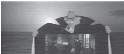
Abb. 3.1–5 TRAIL OF THE PINK PANTHER: Hommage an Peter Sellers, dem einzig wahren Inspektor Clouseau

Ende des Films, Schwinden des Lichts und mise en abyme (der Projektion) (vgl. Abb. 3.1). Sie wendet den Kopf, während der zweite Rahmen sich ausweitet, bis er mit den Grenzen des ersten verschmilzt – die Figur erweist sich als der rosarote Panther, der nach einem Blick in die Kamera Anstalten macht, sich als Exhibitionist zu betätigen, indem er seinen Regenmantel öffnet: doch diese Öffnung offenbart nichts als Leere, d.h. Schwärze, und auf dem innerhalb des Bildes ausgeschnittenen neuen schwarzen Grund taucht wiederum ein zweiter Rahmen auf, der sich seinerseits vergrößert, bis er die ganze Leinwand ausfüllt, und in dem nun die Huldigungsszenen an Sellers/Clouseau vorbeiziehen (vgl. Abb. 3.2–5). Die Exhibition ist also doppelt enttäuschend: Der ausbleibende Penis des Panthers passt zum Verschwinden des Bildes (dem Schwarz), und die Schwierigkeit, den Verlust zu verarbeiten, mündet in einer Verleugnungshaltung, die einen Fetisch schafft (und sich auf ihn stützt, vgl. Freud 1975). Die Anthologie der Gags ist ein Partialobjekt, das metonymisch nicht nur auf die vorangegangene Erzählung, sondern auf die gesamte PINK PANTHER-Serie verweist: Sie tritt an deren Stelle, um die Abwesenheit zu kaschieren, und deckt sie doch wie jeder Fetisch zu-