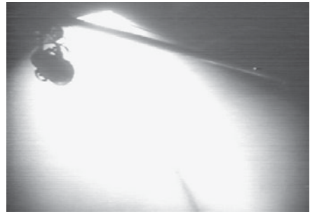
Abb. 4.1–6 THE MAGNIFICENT ANDERSONS: Orson Welles Off-Stimme stellt Mitwirkende und Stab vor

den. Die Stimme des Schöpfers, die die Bilder zu erschaffen oder sie zu beleben scheint, geht hier niemals das Risiko ein, ihre Allmacht zu schmälern, indem sie sich inkarniert – wie es zum Beispiel im Nachspann bei Sacha Guitry geschieht, dem Welles hier huldigt. Und die Identifizierung dieser Stimme in der letzten Einstellung durch den berühmten Satz «My name is Orson Welles» ist als Apotheose inszeniert, mit einem vertikalen Schauer vom Himmel herabfallenden Lichts und der Erhebung des Mikros, die, statt dieser Stimme eine bestimmte