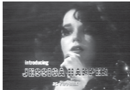
Abb. 2.1 und 2 Vorspannsequenz von Brian de Palmas PHANTOM OF THE PARADISE