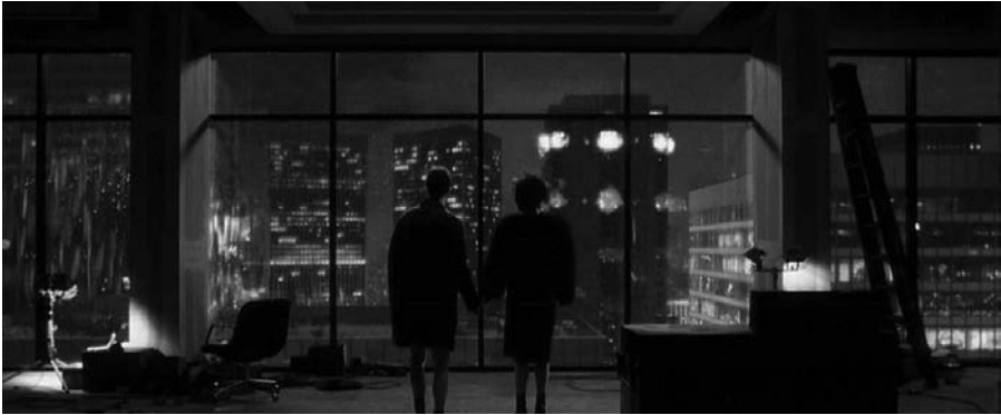
Abb. 2 Das Ende von FIGHT CLUB: Die Zuschauer teilen einen Moment des Staunens und der Zerstörung (und einen Wahrnehmungs- und Bedeutungsraum) mit Marla und Jack.

tisches Wertesystem in Frage, das manche Zuschauer vielleicht schätzen, während andere es ebenso kritisch sehen; doch geht er in seiner Herausforderung der Gesellschaft nicht so weit wie Tyler. So wird der Einsatz physischer Gewalt als Mittel der (Selbst-)Befreiung sowohl von Jack und Tyler als auch von verschiedenen Zuschauergruppen (z. B. Pazifisten oder gewaltbereiten Radikalen) unterschiedlich beurteilt. Darüber hinaus öffnet Jack sich Marla durch seine Liebe, für Tyler ist sie nur ein Sexobjekt.