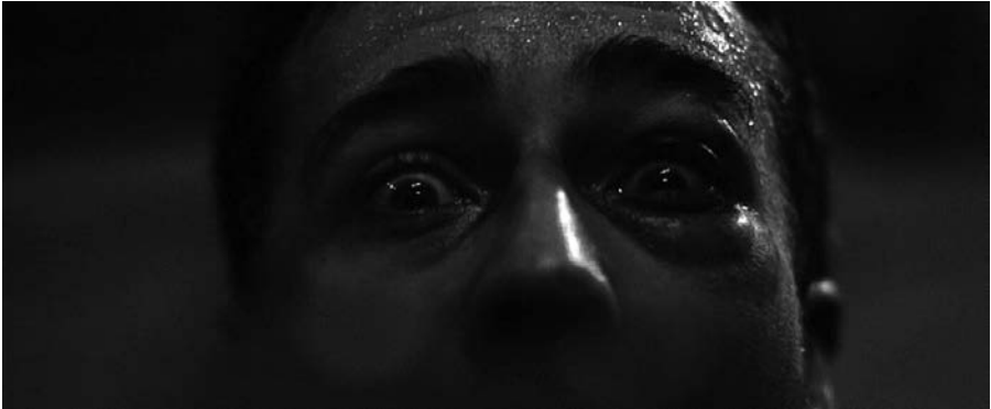
Abb. 1 Der Anfang von FIGHT CLUB: Jack, mit einer Pistole im Mund, starrt direkt in die Kamera (parasoziale Interaktion)

sich die mentale Perspektive der Zuschauer von derjenigen Jacks zwar durch ihren Modus, richtet sich jedoch auf dieselben intentionalen Gegenstände und hat einen ähnlichen Gehalt. Gerade weil die Zuschauer nur den Gehalt, nicht aber den Modus von Jacks mentalen Prozessen erfahren, können sie auch dazu verführt werden, seine fehlerhafte epistemische Perspektive zu übernehmen (indem sie seine halluzinierten Begegnungen mit Tyler für real halten), dann seine konative Perspektive (Wissenwollen, wo Tyler ist) und schließlich seine affektive Perspektive (die Überraschung über die Enthüllung, dass Jack selbst Tyler ist). Von Moment zu Moment entwickeln sich subtile Wandlungen perspektivischer Relationen. In mancher Hinsicht bleiben die Perspektiven von Figuren und Erzähler offen; so lässt der scheinbar unbeteiligte Tonfall des Ich-Erzählers dessen Haltung zum Geschehen häufig im Unklaren.