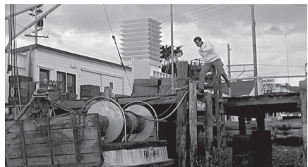
Abb. 2 Acht Einstellungen der Bodega-Bay-Sequenz aus THE BIRDS (USA 1963, Alfred Hitchcock), in Bellours Zählung: E 76 – E 83, je v.l.n.r..

kontinuierliche PoVs. 24 Die letzte Point-of-View-Einstellung dieser Szene ist besonders interessant. Sie zeigt Melanie (E 81 – vgl. Abb. 2), wie sie ihre blutige