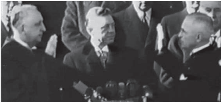
4, 5 It's ALWAYS FAIR WEATHER (VORWIEGEND HEITER, USA 1955, Gene Kelly/Stanley Donen).

informieren, wobei diese Nachahmung mehr oder weniger treu und ein Element des Plots/Diskurses daher auch mehr oder weniger diegetisch sein kann.