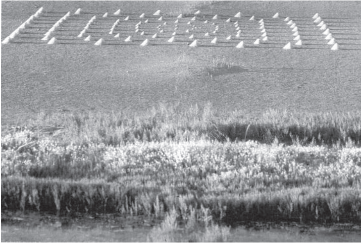
2 Die Landschaft (3D) erzeugt in der koplanaren fotografischen Abbildung einen ambivalenten räumlichen Eindruck.

endliche erstreckt, begrenzt ist. Dies bewirkt, dass das Off – der Kontext – dem Vorstellungsvermögen des Betrachters überlassen bleibt.