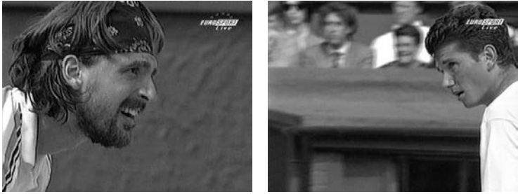
Abb. 6, 7

In diesem Zusammenhang kann die Montage auch dazu dienen, die psychologische Reaktion eines Protagonisten dadurch zu überhöhen, dass sie in einer Abfolge verschiedener Einstellungen kontinuierlich wieder aufgenommen wird. Nach einem missglückten Volleyschlag McEnroes im Tiebreak des 4. Satzes des Finales 1980 wird der Ausdruck der Enttäuschung des Amerikaners, der sich zunächst ostentativ die Augen mit beiden Händen zuhält, in sieben aufeinander folgende Einstellungen zerlegt (K1; zwei verschiedene seitliche Ansichten; Kamerafahrt am Netz entlang; K1; Großaufnahme, K1). Unmittelbar vor dem Servieren eines Matchballs unterstreicht 1998 eine Montage von zwei Großaufnahmen den Blickwechsel zwischen beiden Spielern und verstärkt so den Eindruck eines intensiven psychologischen Duells (Abb. 6, 7).