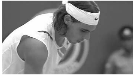
Abb. 10, 11

tur das seinerseits fetischistische Verhalten der Frau (ihre beiden Hände umklammern nervös einen Ball), andererseits löst sie dieses ikonische Fragment aus dem Boulevard-Kontext der Royal Box heraus, um es als Archetyp des Zuschauerverhaltens (halb angespannt, halb passiv) vermittels einer Überblendung zu einer Totalen des Stadions in einem anderen Licht erscheinen zu lassen. Der zoom-out wird übrigens bei mehreren Gelegenheiten verwendet, um die Beziehungen zwischen bestimmten Persönlichkeiten im Publikum und Spielern auf dem Platz herauszustellen: So gleitet man etwa von Vater Federer zu Rafael Nadal (um den Antagonismus zwischen beiden Lagern zu unterstreichen) oder von John McEnroe in seiner Kabine zu Roger Federer (um den Akzent auf die Beziehung zwischen zwei verschiedenen Spielergenerationen zu legen). Sehr viel prosaischer verbindet eine andere Kamerabewegung Nadals Gesicht mit dem offiziellen Logo des Turniers, das auf einer Tribüne angebracht ist (Abb. 10, 11). Dieser Zoom lässt sich auf zwei unterschiedliche Weisen interpretieren. Signalisiert er das sich zu dieser Zeit vollziehende Eingehen des iberischen Sportlers in die Geschichte einer so prestigeträchtigen Veranstaltung wie Wimbledon? Oder markiert er vielmehr den Punkt, an dem sich die Auflösung der Gestalt des Champions in eine rein graphische Gegebenheit vollzieht und verweist so auf den artifiziellen Charakter des Fernsehspektakels, das vom Dispositiv erstellt wird, dem die Kamera zugehört?