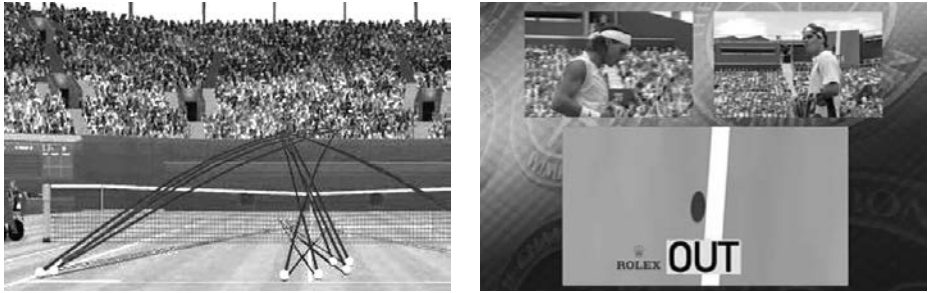
Abb. 18, 19

Blick den Klagen eines Jean-Luc Godard Recht zu geben, ist es doch angebracht daran zu erinnern, dass eine derartige Objektivierung des menschlichen Körpers alles in allem weniger auf eine Regression verweist, die der heutigen Kultur eigen wäre, als vielmehr den Abschluss eines im 19. Jahrhundert in Gang gesetzten Prozesses darstellt, in dem der Film eine herausragende Rolle gespielt hat.