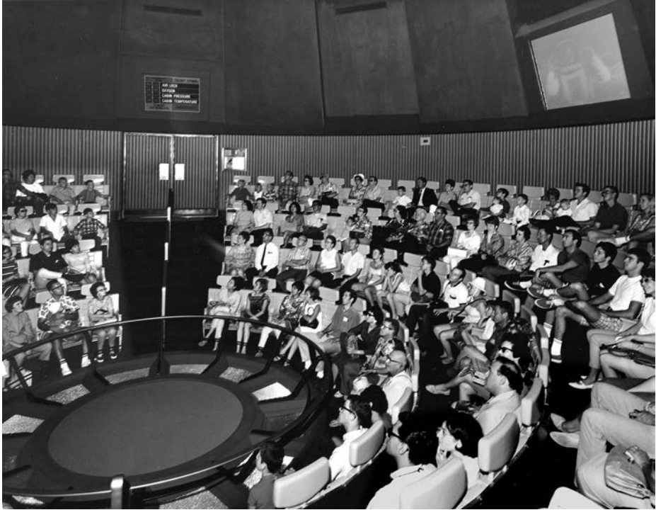
1 «Trip to the Moon», Disneyland, Kalifornien. Simulation einer Reise ins Weltall. Allerdings hatten der Schriftsteller H.G. Wells und der Filmpionier Robert Paul Disneys Idee bereits 50 Jahre zuvor vorweggenommen