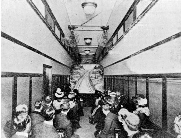
1 Hale's Tours, Vineland