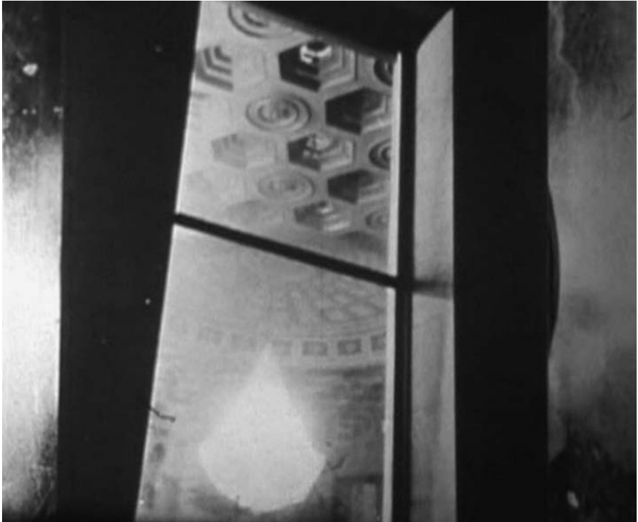
(NOSTALGIA) von Hollis Frampton, 1971