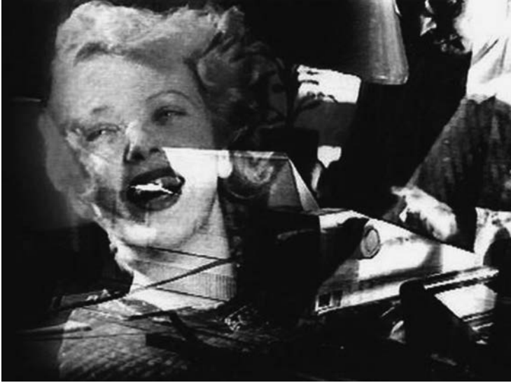
2 The Man with the Typewriter: Jean-Luc Godard als Apostel der erlösenden Kraft des Kinos beim Beschriften von Bildern in HISTOIRE(S) DU CINÉMA.

das Kino dem Kommerz, dem «commerce» des narrativen Kinos, und verkannte so die «erlösende Natur des Bildes»,