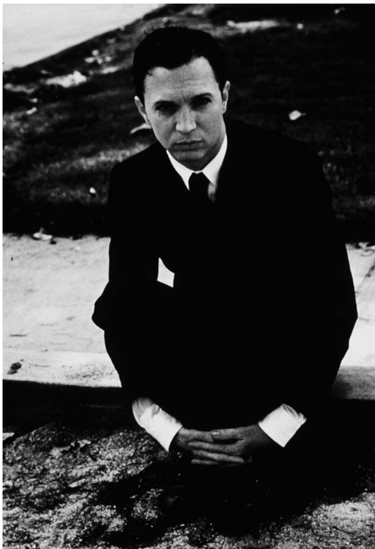
Bruce LaBruce als Jürgen Anger in HUSTLER WHITE (Bruce LaBruce mit Rick Castro, USA 1996)