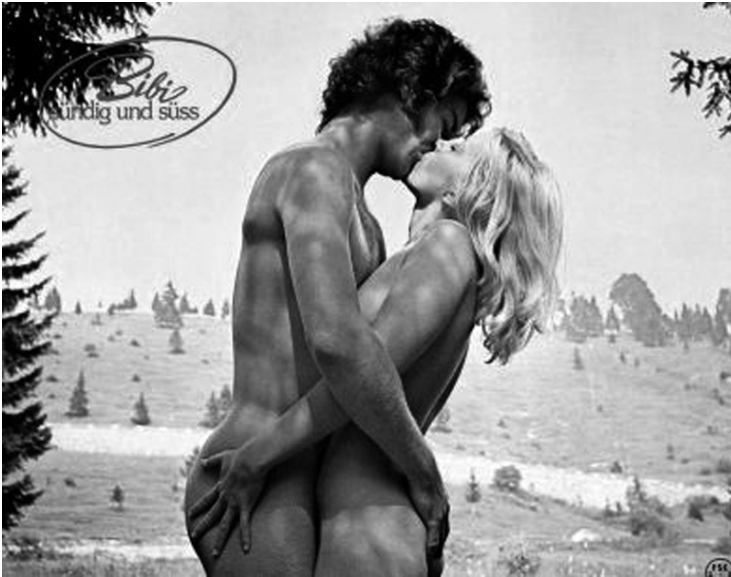
Joseph P. Sarnos BIBI – SÜNDIG UND SÜSS (1976)

ge der schwedischen Gesellschaft. Gleichwohl lässt es sich der Film nicht entgehen, junge, barbusige Frauen zu zeigen. SVEZIA, INFERNO E PARADISE aktualisiert (und erotisiert) damit die politische Kritik an Schweden aus den fünfziger Jahren, die sich teils gegen die Sexualaufklärung in der Schule, teils gegen deren sozialstaatlichen, verordneten Charakter richtete (vgl. Lennerhed 1994, 95).